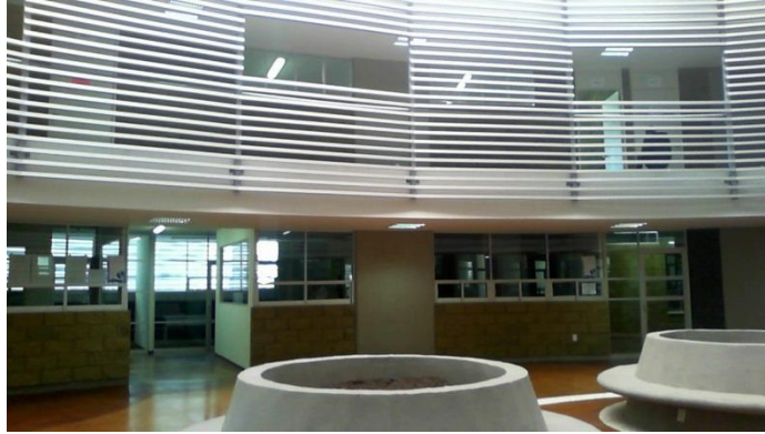
Vista parcial del interior del edificio 5 del Campus la Concepción.

pasado mes de octubre fue concluido el pórtico del acceso principal al Campus La Concepción.