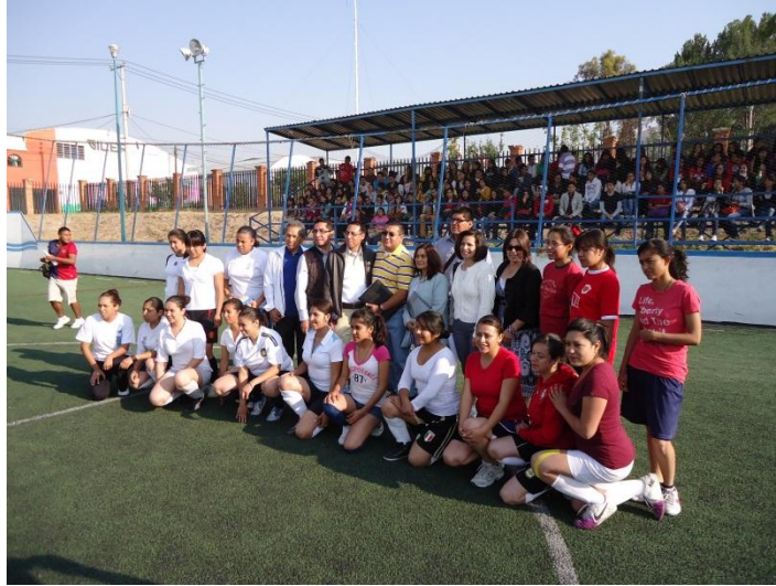
Encuentro inaugural del torneo deportivo ICEA 2013. Villa Universitaria "Mario Vázquez Raña".