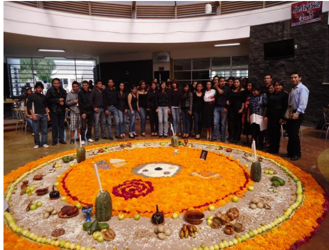
Expresión artística con motivo de la celebración del día de muertos por parte de alumnos del Programa Educativo de licenciatura en Contaduría. Campus la Concepción, noviembre de 2013

y música, conferencias culturales, presentaciones de cine, música, teatro y artes visuales; Exposiciones de artes plásticas, lectura de poemas, visitas culturales guiadas al Centro Cultural La garza y a museos en la Ciudad de México así como presentaciones de libros. Adicional a los eventos culturales internos, los alumnos participaron en la “Feria del Libro 2013”, el “Festival Internacional de la Imagen 2013” y el “Lenguaje Day”.