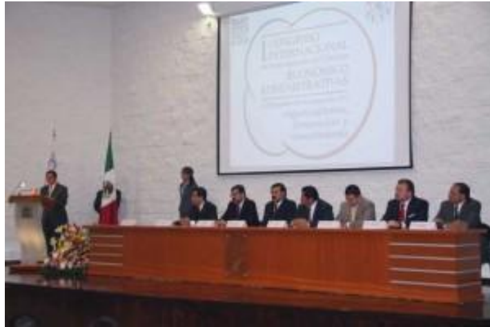
Inauguración del 1er Congreso Internacional de Investigación en Ciencias Económico Administrativas. Campus La Concepción

Stanford y Director y fundador del Proyecto PublicKnowledge en la Universidad de Stanford, el cual durante su estancia académica ofreció a la comunidad universitaria dos talleres el primero denominado “Nuevos modelos para la publicación de la investigación y el saber” y el segundo “El mundo del conocimiento on line” el cual tuvo una participación activa de 25 investigadores de nuestro Instituto y para finalizar impartió la conferencia magistral “La nueva promesa internacional del conocimiento abierto”.