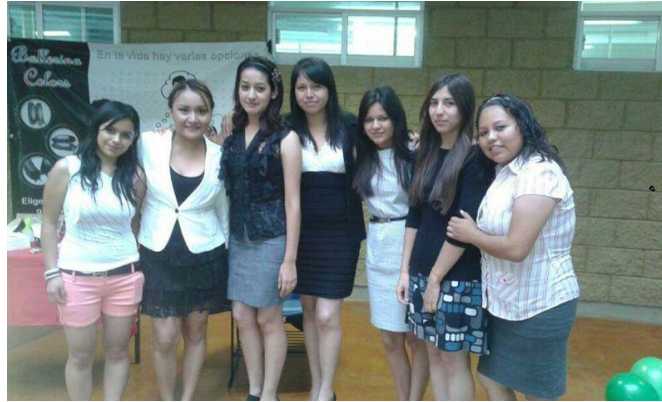
Alumnos de la Licenciatura en Administración, creadores del proyecto BallerinaColors.