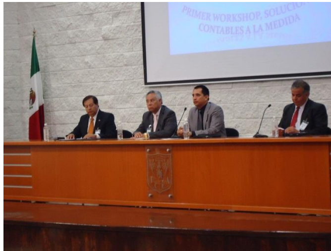
Ceremonia de inauguración del 1er. Workshop en Contabilidad. Campus La Concepción.

Por su parte, el Programa Educativo de Contaduría organizó el 1er. Workshop en Contabilidad con 34 ponencias presentadas por profesores provenientes de Colima, Aguascalientes y Pachuca (participaron 15 docentes y 250 alumnos).