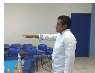
"Reacciones Químicas en la elaboración de salsas"