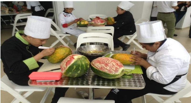
Fotografía. 24. Práctica de Mukimono por parte de los alumnos de la Licenciatura en Gastronomía

regaderas y vestidores; dos cubículos para investigadores, espacios en donde mil 703 alumnos pondrán en práctica sus conocimientos con el apoyo de 140 docentes y 16 investigadores universitarios.