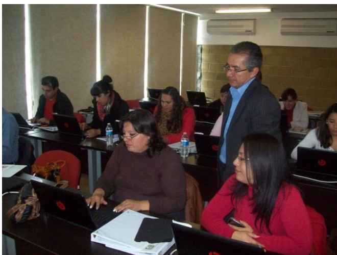
Fotografía núm. 3. Profesores del Área Académica de Mercadotecnia participando en el taller disciplinar “Marketing Digital”.

En relación a la capacitación y actualización docente, en el periodo que se informa 57 profesores aprobaron algún curso en Competencias Comunicativas para el Idioma Inglés, 47 en Competencias en Tecnologías de la Información y Comunicación y 45 en Competencias en Metodología de la Investigación, 45 en Competencias en el Modelo Educativo, cursos ofrecidos por la Dirección de Superación Académica de la Institución. Por otra parte, en el Instituto se ofertaron tres cursos disciplinares: “Marketing Digital”, con la participación de 21 profesores del área académica de Mercadotecnia; “Ecoturismo, Turismo Sustentable y Arquitectura Ambiental” donde tomaron parte 22 profesores del área académica de Turismo-Gastronomía y “Aplicaciones Tecnológicas Aplicadas al Comercio Exterior” con la participación de 15 maestros.