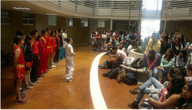
Fotografía núm. 10. Exhibición de Capoeira impartida a los alumnos del PE de Licenciatura en Mercadotecnia.