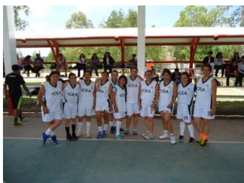
Serie fotográfica A. Selecciones de futbol rápido y basquetbol del ICEA.