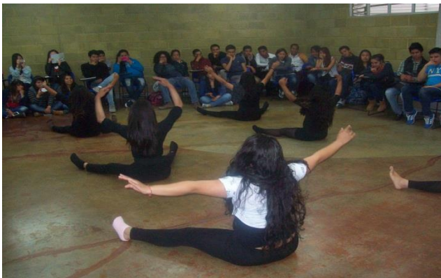
Foto núm. 15. Actividad en taller de teatro desarrollado en la licenciatura en Turismo. Octubre de 2015.