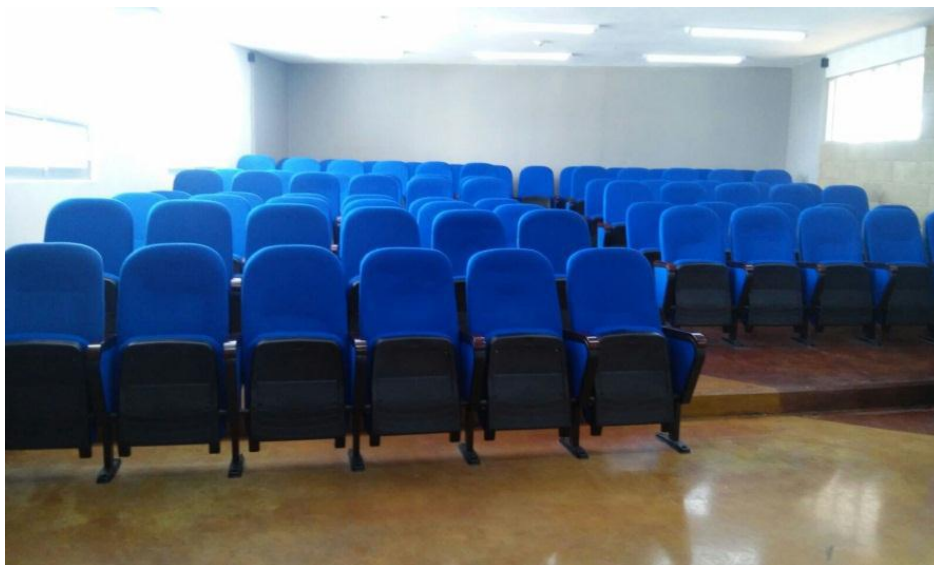
Fotografía No. 25. Detalle del aula audiovisual del edificio “E”, de la Licenciatura en Mercadotecnia.

Por otra parte en el Edificio “E” del Área Académica de Mercadotecnia, se equipó el aula audiovisual con 104 butacas, pantalla de TV y equipo de sonido, con lo cual se encuentra completamente habilitada para llevar a cabo actividades académicas y culturales. Así mismo se equiparon con tecnología multimedia (pantalla de TV, bocinas, interconexión inalámbrica de audio y video, computadora lap top) 7 aulas de Contaduría en el edificio “B”, 7 aulas de la licenciatura en Turismo en el edificio “A”, 2 aulas de la licenciatura en Economía y 8 aulas del edificio “C” del Área Académica en Administración, para integrar un total de 24 aulas con tecnología que permite mejorar la enseñanza y acelerar el aprendizaje.