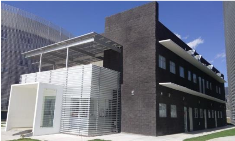
Fotografía. 23 Edificio de Laboratorios de Gastronomía

Igualmente fue inaugurado el módulo de laboratorios de la Licenciatura en Gastronomía que constan de seis Laboratorios (Cocinas), Laboratorio de panadería y repostería; cámara de congelación y refrigeración; dos laboratorios de enología; cocina de apoyo (banquetes); aula de banquetes y coctelería; terraza, área para escultura en hielo; dos almacenes; dos módulos de sanitarios con