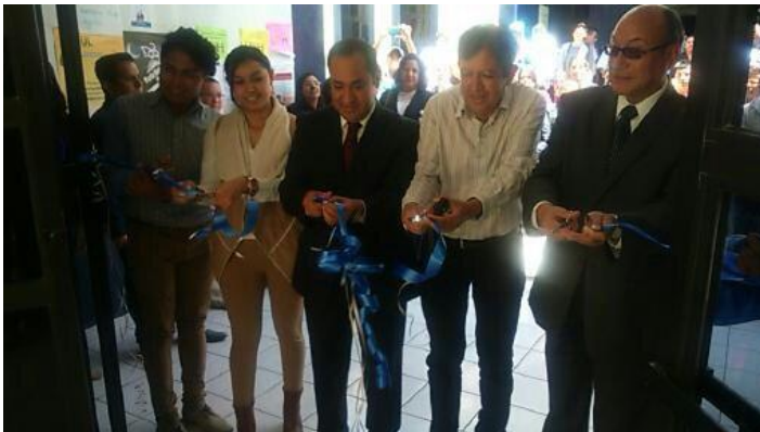
Fotografía núm. 11. Inauguración de la exhibición de pinturas en acuarela. E.S. de Tepeji del Rio, UAEH. Agosto 2015

En el mes de agosto pasado se llevó a cabo un encuentro académico, cultural y deportivo entre el ICEA y la comunidad universitaria de la Escuela Superior de Tepeji del Rio. En este marco, se llevaron a cabo presentaciones sobre los principales productos de investigación desarrollados por el Cuerpo Académico de Gestión y Desarrollo Empresarial, para posteriormente sostener reuniones de trabajo entre profesores de ambas partes a fin de abordar proyectos de investigación de manera conjunta. Posteriormente se realizaron exhibiciones artísticas, como la presentación de talentos musicales del Instituto y de la Escuela anfitriona, así como la exhibición de obras de acuarela, para finalmente concluir con los encuentros deportivos en las modalidades de fútbol rápido y basquetbol en ambas ramas.