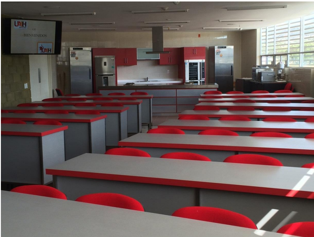
Fotografía No. 22. Laboratorio de Cocina Show, Edificio "F" del ICEA.

En relación al rubro de infraestructura, el pasado 19 de marzo, en el Instituto de Ciencias Económico Administrativas (ICEA) se inauguró el Edificio "F" de docencia del Área Académica de Turismo-Gastronomía, el cual consta de 18 aulas, elevador, área administrativa, sala de juntas, área de tutorías y asesorías, laboratorio de Cocina Show, un laboratorio tecno sensorial, un laboratorio de fotografía y 11 cubículos.