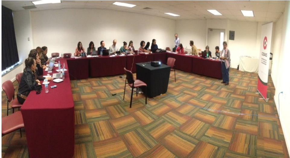
Fotografía No. 2: Sesión de trabajo en la reunión informativa del proyecto CODAES (Comunidades Digitales para el Aprendizaje en la Educación Superior). Participación de ocho Instituciones Educativas. 25 de agosto de 2014

El proyecto tiene por objetivo construir comunidades digitales, dedicadas al desarrollo de objetos de aprendizaje y herramientas de apoyo a los procesos de enseñanza y aprendizaje, que fomenten la innovación educativa, la formación de formadores, la actualización docente y la vinculación de la universidad con la sociedad.