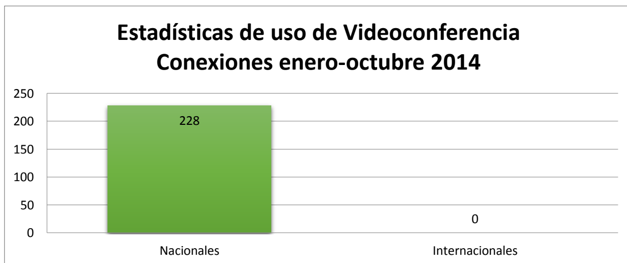
Gráfica No. 2: Uso de Videoconferencias Nacionales / Internacionales, periodo Enero-Octubre 2014.