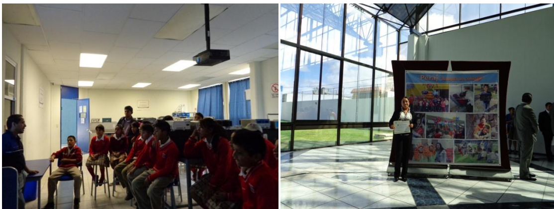
Fig.12. Actividades Programa Peraj.