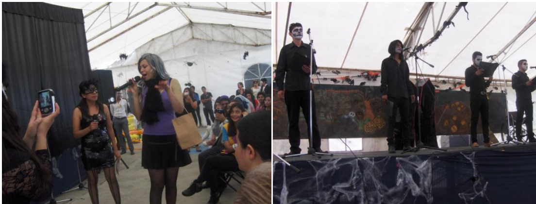
Fig. 10. Actividades de Language Day.