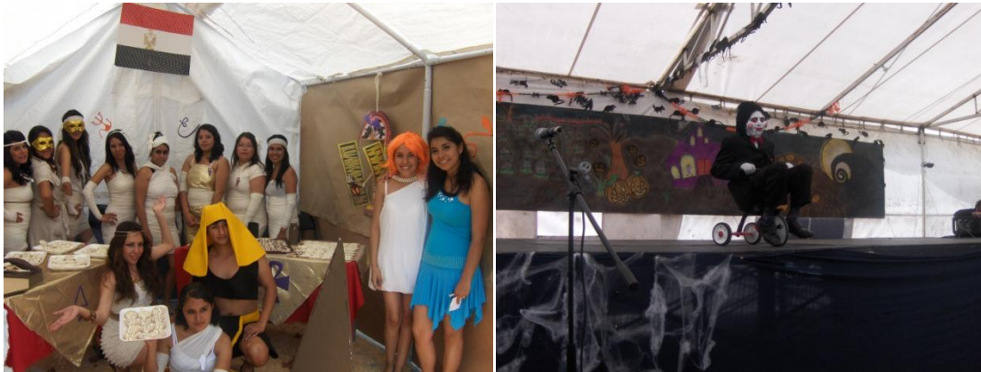
Fig. 9. Actividades de Language Day.

El día 31 de octubre la comunidad estudiantil se unió a la celebración del “Language Day” con la participación de los profesores de idiomas (inglés y francés) y los estudiantes de los cinco PE. Los estudiantes comunicándose en una lengua extranjera mostraron los conocimientos adquiridos y la creatividad para realizar actividades científicas, culturales y gastronómicas, como se muestra en las Figuras 9 y 10.