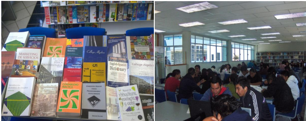
Fig. 14. Acervos y usuarios

Además continúa brindando el servicio de acceso a internet (intermitente) a alumnos y maestros, apoyo en la aplicación de exámenes diagnósticos del idioma inglés, y en las evaluaciones institucionales.