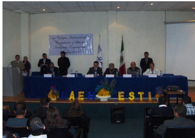
Fig.4. Actividades del 1 er Coloquio Internacional de Computación y Sistemas Inteligentes 2013.

Los trabajos de investigación del coloquio quedaron registrados con el ISBN: 978-607-482-349-3, como se muestra en la Figura 5.