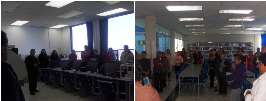
Fig. 13. Recorrido de la Instalaciones de la ESTi a Padres de Familia.

Como parte esencial de incluir a las partes fundamentales de la formación integral de los alumnos, los Coordinadores de programa educativo llevan a cabo reuniones independientes con los estudiantes de nuevo ingreso y con los Padresde familia. (Fig. 13)