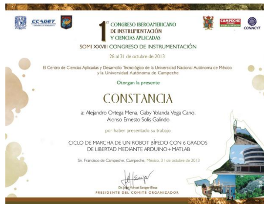
Fig 3. Constancia de participación en el SOMI XXVIII Congreso de Instrumentación.

Dos alumnos de Ingeniería en Electrónica y Telecomunicaciones, participaron como Ponentes en la modalidad de Poster, en el Congreso de Instrumentación CIICA 2013-SOMIXXVIII en Campeche, México, con los Artículos, "Ciclo de Marcha de un Robot Bípedo con 6 Grados de Libertad mediante Arduino+Matlab", "Sistema de Monitoreo basado en Redes de Colaboración Inteligentes" y "Encriptación de Dos Sistemas de Lorenz por el Método de Pécora y Carroll, Utilizando Matlab".