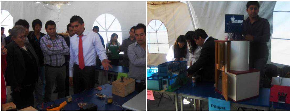
Fig. 7. Exposiciones de Proyectos en la XX Semana Nacional de la Ciencia y Tecnología.

De igual forma, en coordinación con la Fundación del Premio Nacional de Tecnología e Innovación se realizó la 3ª Jornada de Empresas Ganadoras del Premio Nacional de Tecnología con la asistencia de empresarios, funcionarios municipales y estudiantes.