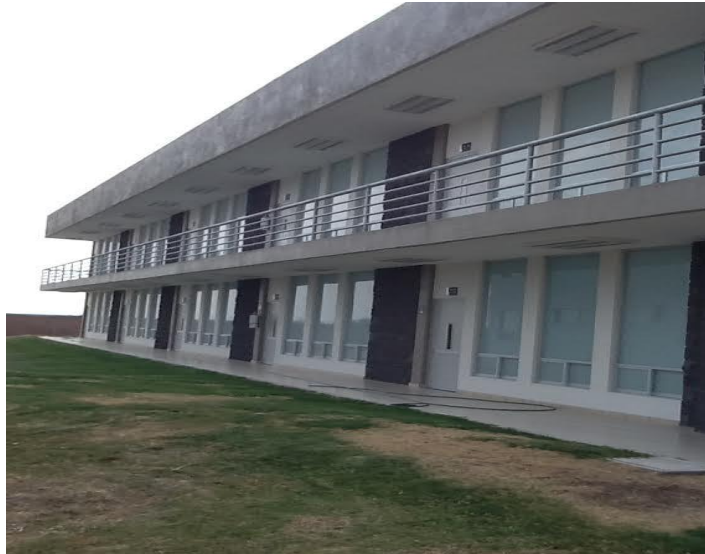
Fig. 16. Módulo tres de la ESTi.

En relación a las Instalaciones, mobiliario y equipo con el apoyo de Rectoría y del Patronato Universitario se logró la construcción de un tercer módulo con 9 aulas, cubículos, sala de juntas, site, oficina de coordinador y sanitarios, se realiza conforme a lo programado con una inversión de $7, 920,096.23 quedando pendiente el equipamiento de mobiliario, equipo audiovisual y de cómputo. (Fig. 16)