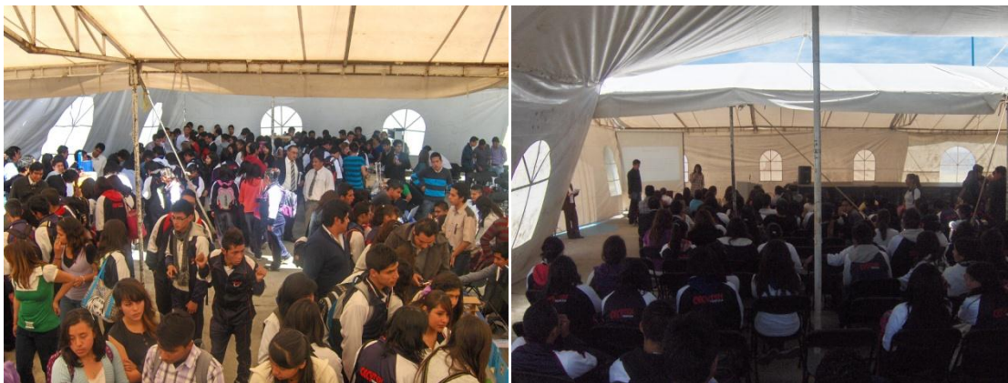
Fig. 8. Conferencias en la XX Semana Nacional de la Ciencia y Tecnología.