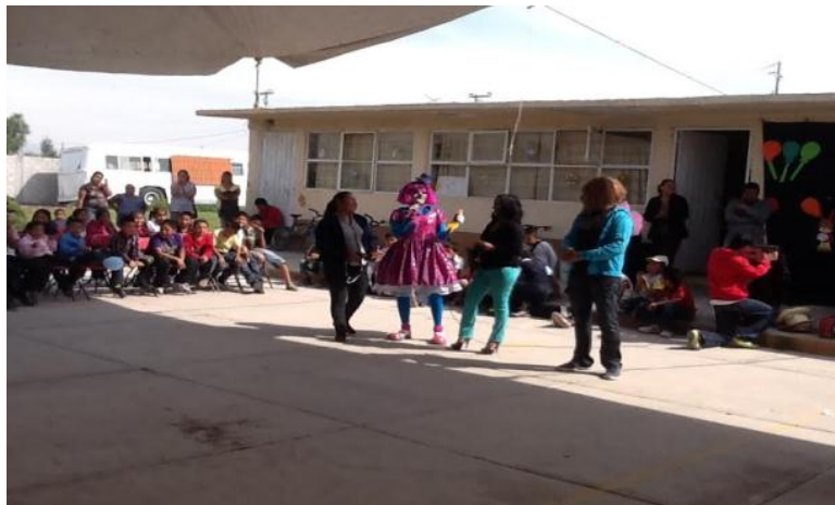
Fig. 15. Día del Niño PERAJ

El área de psicología apoyó el Proyecto PERAJ con talleres psicodinámicos como el "Taller de autoconocimiento para los niños" y "Taller para Padres de familia" de los niños tutorados. Realizó una plática sobre "¿cómo dirigirse a los niños?" para los estudiantes tutores. A los niños tutorados se le aplicó la prueba Machover (dibujo de la figura humana) como parte del diagnóstico psicológico.