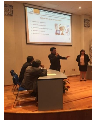
Lambda Tech Business Solutions exponiendo su idea de negocios.

Durante el mes de Junio se asesoró a la empresa Lambda Tech Business Solutions, Desarrollo de soluciones Empresariales . Esta organización tiene como objeto social, la consultoría dedicada al desarrollo de software acorde a las necesidades específicas de cada negocio con la finalidad de hacerlo más competitivo.