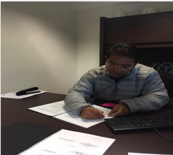
Firma de Convenio con la empresa Trinity Industries de México