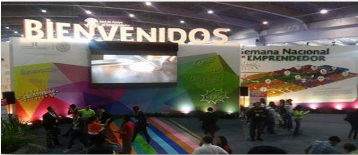
entrada a la Semana del emprendedor.

El día 8 de octubre, como parte de las materias de micro y pequeña empresa, desarrollo empresarial y proyectos de inversión de la Licenciatura en Administración; así como de las materias de interacción, materia y energía de la licenciatura en Ingeniería industrial, nuestros alumnos asistieron a la Semana Nacional del Emprendedor. Lo anterior con la finalidad de impulsar los conocimientos de nuestros estudiantes, así como promover el desarrollo de su espíritu emprendedor.