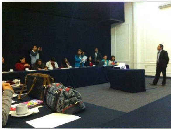
Reunión el Grupo Intercambio en Hotel Real del Bosque.