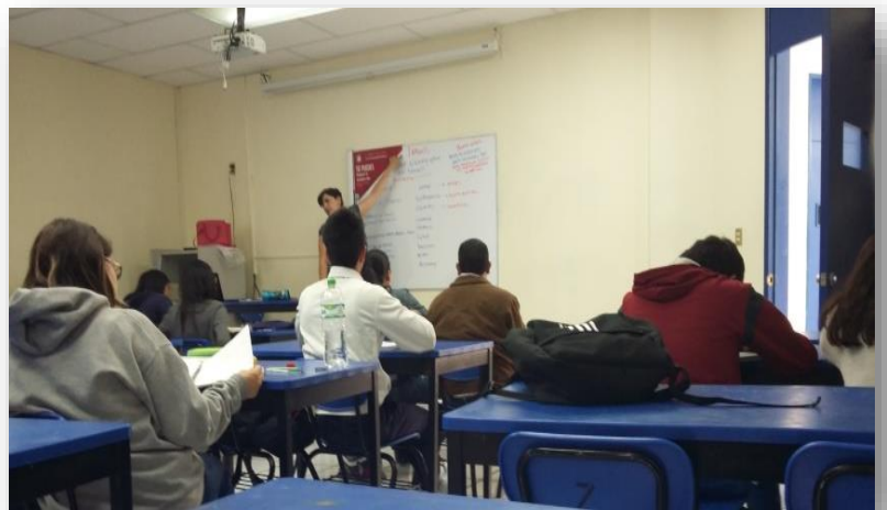
Primer día de clases del curso de Inglés básico.

Como parte de las actividades de educación continua, se desarrolla un curso de inglés en el nivel I, el cual tiene la modalidad sabatina y cuenta con un total de 16 integrantes entre alumnos y personas externas. Este curso inició el 15 de Agosto y finalizará el 05 de Diciembre.