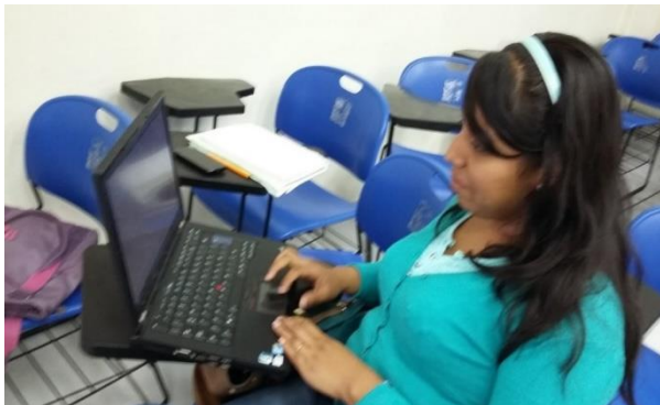
alumna del curso trabajando en una práctica de COI.

Del 15 de junio al 10 de Julio de 2015, se realizó el curso de Contabilidad COI-NOI, al cual asistieron 12 participantes entre los cuales se encontraban alumnos y egresados de la nuestra institución, así como personas externas. El curso tuvo una duración de 40 horas y al finalizar el mismo, se realizó entrega de constancias.