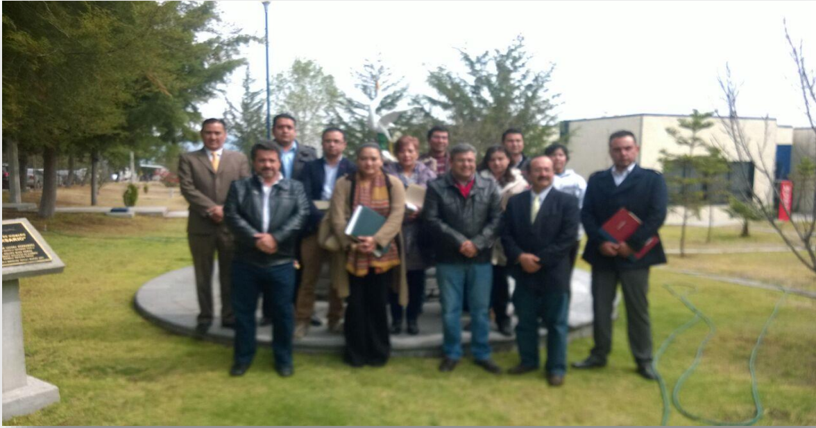
Segunda Reunión de la Red de Incubadoras de Empresas Universitarias.