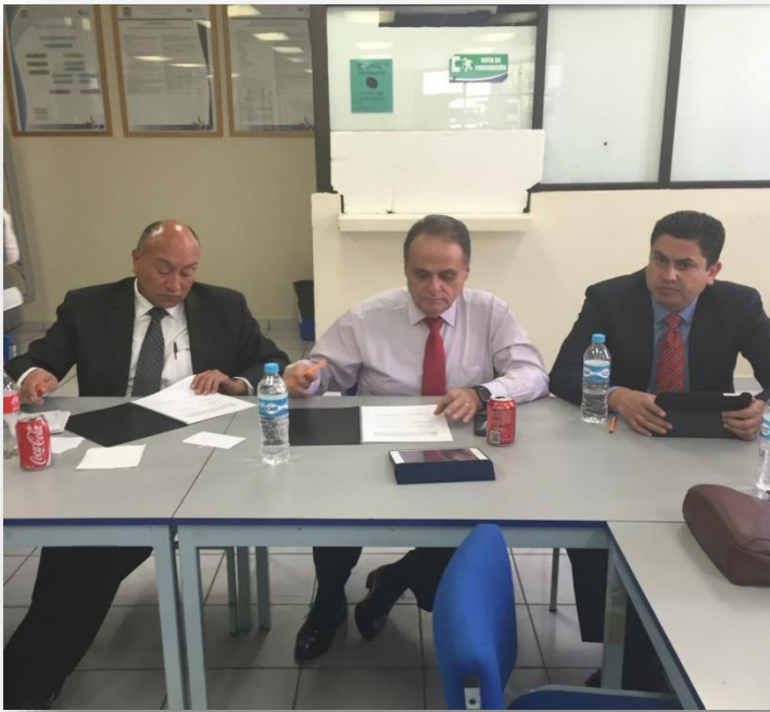
Firma de Convenio con la empresa Trinity Industries de México.