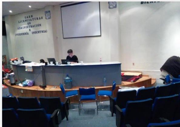
evento Bootcamp Tepeji del Rio.