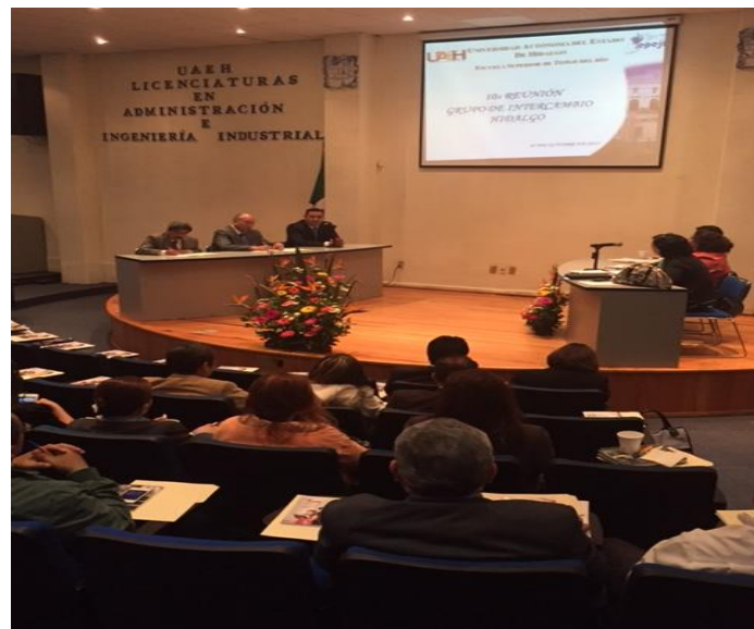
Reunión el Grupo Intercambio en la Escuela Superior Tepeji.

En la reunión participaron 45 personas representantes de las empresas asociadas a este grupo, además se contó con la presentación de la Empresa Consultora “Lambda Tech”, empresa experta en desarrollo de Software, ésta última fue incubada en la Escuela Superior Tepeji. Entre otros temas se realizó intercambio de vacantes, y ofertas laborales entre las empresas e instituciones educativas. En la reunión participó el MC. Miguel Ángel Islas, de la División de Vinculación.