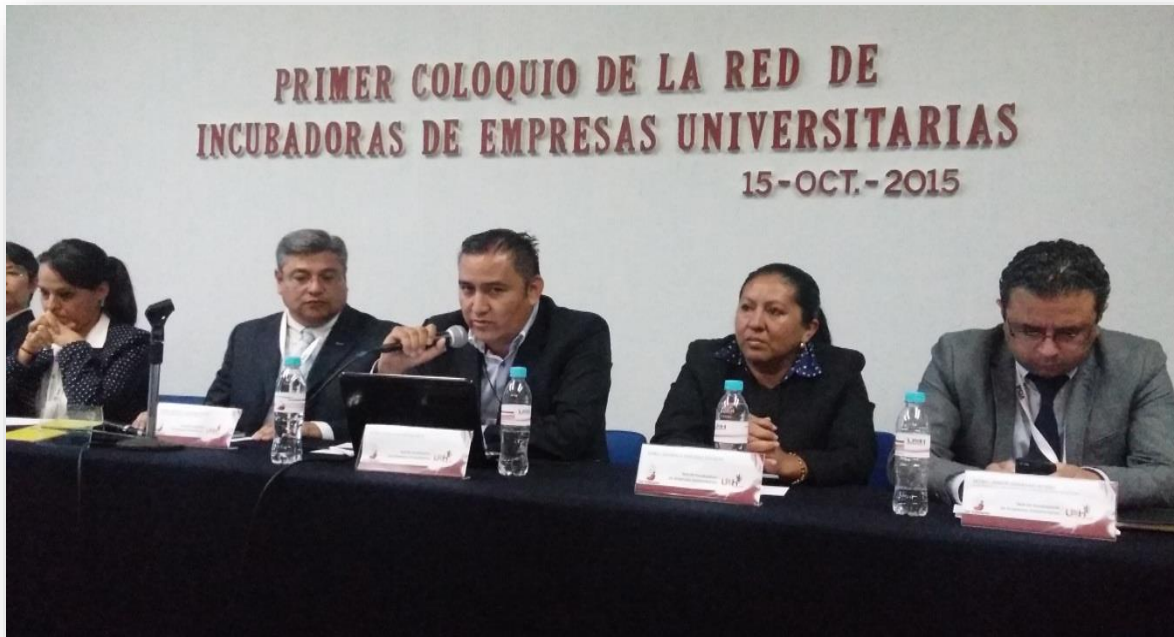
Mtro. Juan Luis exponiendo el tema "Ecosistema Emprendedor", en el Primer coloquio de la Red de Incubadoras de Empresas Universitarias.