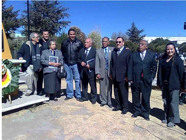
Participantes en el acto cívico conmemorativo del aniversario luctuoso del Lic. Villaseñor

fundador del complejo industrial de Cd. Sahagún, organizado por el Grupo Promotor de la Cultura y el Deporte de Cd. Sahagún.