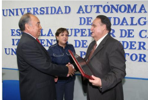
Reconocimiento de Bandera Blanca en la ESSAH

en el estado y en el país que recibe el reconocimiento por la Secretaría de Salud, por realizar acciones preventivas en beneficio de la comunidad universitaria. El reconocimiento es otorgado a las instituciones educativas que cumplen con los indicadores que avalan acciones realizadas en prevención de salud de la comunidad académica y estudiantil.