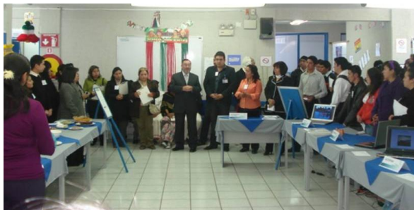
Alumnos de los PE de Contaduría e Ingeniería Industrial evaluados en Inglés