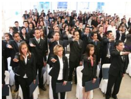
Alumnos en la Toma de Protesta durante la Ceremonia de Titulación de la ESSAH de septiembre 2010