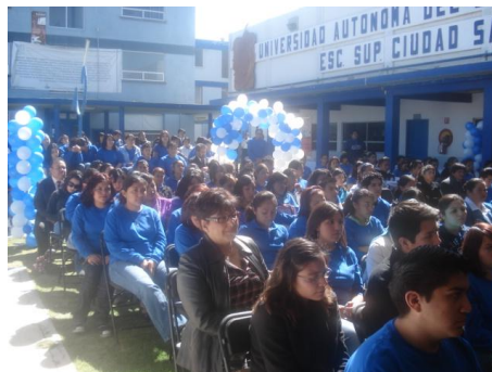
Alumnos, profesores e invitados participantes en la celebración del 10º aniversario de la ESSAH