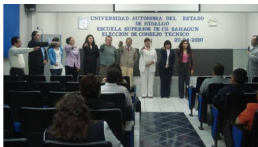
Maestros en la toma de protesta como consejeros técnicos maestros propietarios y suplentes de la ESSAH

Para dar cumplimiento a la normatividad universitaria, de acuerdo al Estatuto de General, se eligió por primera vez en la ESSAH a los cinco consejeros maestros propietarios y a cinco maestros consejeros suplentes, para integrar el Consejo Técnico, órgano que tiene las atribuciones de dictaminar sobre los asuntos académicos, técnicos, científicos, administrativos y de vinculación, entre otros, de la escuela.