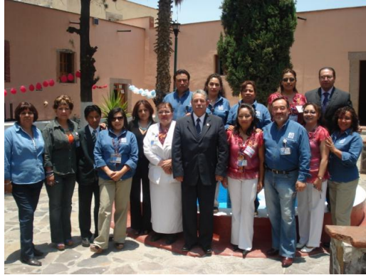
Alumnos y profesores de las escuelas superiores de Tlahuelilpan y Ciudad Sahagún participantes en el “English Day”

La Academia de Inglés de la ESSAH organizó e implementó una evaluación final bajo competencias al 80% de los alumnos que cursaron inglés, en donde fungieron como evaluadores los representantes de la Dirección Universitaria de Idiomas (DUI) de la UAEH, profesores de inglés del Instituto Tecnológico de Estudios Superiores del Oriente del Estado de Hidalgo (ITESA), profesores de inglés del área de Educación Continua (Pachuca y de la ESSAH), una tutora del Centro de Autoaprendizaje de Inglés de Tulancingo, funcionarios bilingües del municipio de Tepeapulco y alumnos destacados en el área de inglés de la ESSAH.