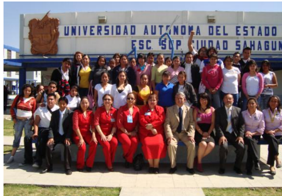
Alumnos y profesores de las escuelas superiores de Tlahuelilpan y Ciudad Sahagún participantes en el “English Day”

Con el objetivo de contribuir a la educación integral de los alumnos de la escuela y fortalecer el aprendizaje del idioma Inglés, la ESSAH realizó el “English Day” con la participación de los alumnos de los programas educativos de Contaduría, Ingeniería Industrial y Profesional Asociado en Trabajo Social y 30 alumnos de la Escuela Superior de Tlahuelilpan. Se impartieron tres talleres en el idioma inglés para los jóvenes universitarios de ambas escuelas superiores con los temas Predicting, Enjoy English with Music y Having Fun with English, así como la actividad Speed Dating en donde se empleó este idioma en una comunicación real.