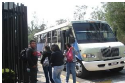
Alumnos de PATS en visita a Cd. Universitaria, UNAM