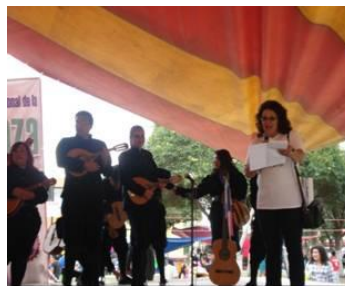
Tuna Azul y Plata de la UAEH, en la Plaza Rodrigo Gómez de Cd. Sahagún

Una parte importante de las funciones sustantivas de la UAEH es la promoción de la cultura en la sociedad, por lo que la Tuna Azul y Plata de la UAEH se presentó en la Plaza Rodrigo Gómez de Cd. Sahagún, como parte de los domingos culturales del municipio de Tepeapulco.