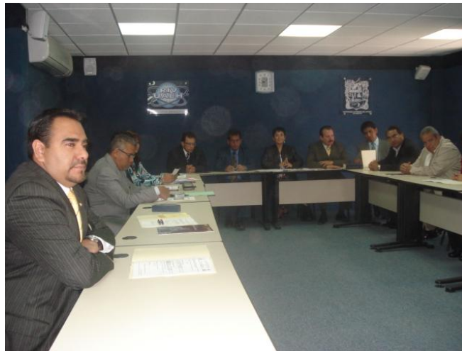
Reunión de Síndicos del SAT en la ESSAH

Una profesora investigadora de la Licenciatura en Contaduría continúa asistiendo a la reunión mensual de la Comisión de Docencia del Colegio de Contadores Públicos de México, como parte de las actividades de esta red que busca el desarrollo de actividades académicas y docentes para los estudiantes de Contaduría. Otra profesora investigadora del mismo PE acude de manera mensual a la Reunión de Síndicos del SAT (Servicio de Administración Tributaria del Estado), con la finalidad de conocer y difundir entre los docentes y alumnos las actualizaciones en materia fiscal contable.