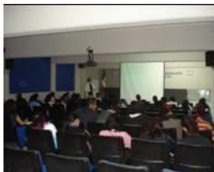
Pláticas a los alumnos de la ESSAH