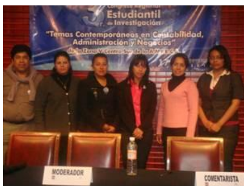
Tercer Congreso Regional Estudiantil de Investigación

Alumnos de 1o., 3o. y 8o. semestre, profesores por asignatura y profesores investigadores de los PE de Contaduría e Ingeniería Industrial, participaron en el Tercer Congreso Regional Estudiantil de Investigación, denominado “Temas Contemporáneos en Contabilidad, Administración y Negocios, de la Zona V Centro Sur de la ANFECA”, organizado por la Universidad Autónoma de Tlaxcala, con los temas “Educación financiera en los jóvenes”, “Programa Delfín, impulsor de la formación de recursos humanos de alto nivel” y “El FOMMUR, una estrategia de microfinanciamiento para la mujer mexicana”.