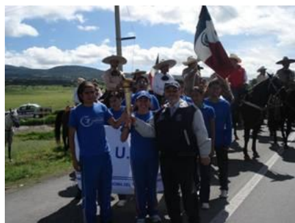
Alumnos, profesores y directivos de la ESSAH en el recibimiento de la Antorcha de los Festejos del Bicentenario en Tepeapulco, Hgo.