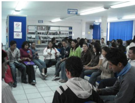
Alumnos de Contaduría e Ingeniería en el concurso de verbos irregulares

Como parte de la formación integral de los alumnos en el idioma inglés, el Centro de Autoaprendizaje de Idiomas realizó un concurso de verbos irregulares en donde participaron 46 estudiantes de los programas educativos de Contaduría e Ingeniería Industrial.