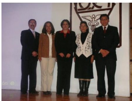
Profesores de la ESSAH participantes en el Primer Coloquio Regional de Educación Superior Basada en Competencias

Como parte importante de la investigación, y como resultado de la participación dentro del Primer Coloquio Regional de Educación Superior Basada en Competencias, profesores investigadores de la Escuela Superior de Contaduría y Administración (ESCA), unidad Tepepan del Instituto Politécnico Nacional, impartieron una plática informativa a profesores investigadores y coordinadores de los programas educativos de Contaduría e Ingeniería Industrial sobre la Metodología de Trabajo para la determinación de los Estudios de Mercado Laboral.