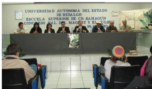
1er. Congreso Nacional del Maguey y Pulque en la ESSAH

La ESSAH fue sede durante un día del 1er. Congreso Nacional sobre el Maguey y el Pulque, derivado de la vinculación con la Asociación de Amigos del Museo del Maguey y el Pulque, el que se impartieron dos conferencias, una obra de teatro y la proyección de un video inédito de la época de Adolfo Hitler, sobre el maguey en la región del altiplano hidalguense.