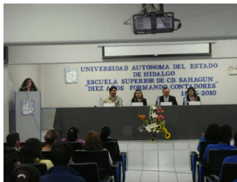
Ceremonia del “Día del Contador”

Se festejó el “Día del Contador” con la entusiasta participación de alumnos y profesores del programa educativo en Contaduría, quienes llevaron a cabo diferentes actividades académicas y culturales, sobresaliendo el Maratón Contable realizado con escuelas de nivel medio superior, como la Escuela Preparatoria “Benito Juárez” de Apan, el Colegio de Bachilleres de Tepeapulco y el Centro de Bachillerato Tecnológico Agropecuario No. 152 de San Juan Ixtimaco. En el mismo marco de festejos, se impartió la conferencia “El Poder de los números” y el Taller de Nómina y Colegio de Contadores Públicos de Hidalgo, por miembros del Colegio de Contadores Públicos de Hidalgo (CCPH), actividades dirigidas al 100% de los alumnos de la carrera de Contaduría y a los alumnos invitados de diferentes bachilleratos.