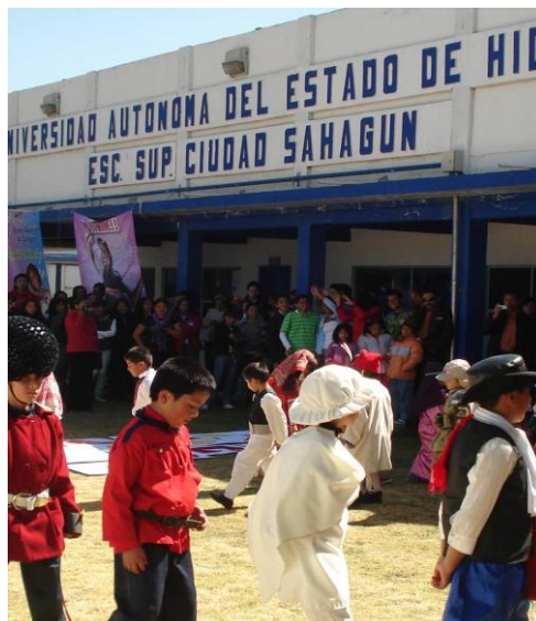
Alumnos de la Primaria “Enedina Lozano” durante su presentación en la ESSAH

La ESSAH mantiene un contacto permanente con las instituciones de educación de la región, de tal manera que la Escuela Primaria Particular “Enedina Lozano” de la localidad de Tepeapulco, presentó en nuestras instalaciones el evento denominado “Carta de las Naciones Unidas”, el cual fue presenciado por la comunidad universitaria.