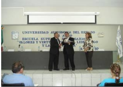
Conferencia "Valores y Virtudes"