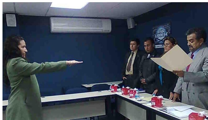
Egresada de Ingeniería Industrial en la toma de protesta

La Coordinación de Planeación de la escuela, en conjunto con la Dirección de Gestión de la Calidad de la Universidad, actualizaron los manuales de organización, procedimientos y plan de calidad.