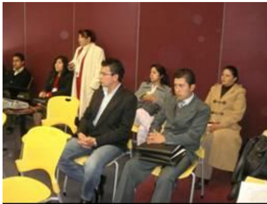
Primer Encuentro de Integración y Articulación de la Investigación

Dos profesoras de la Licenciatura en Contaduría participaron en el V Encuentro Estatal de Investigación en las Ciencias Económico Administrativas y Primer Encuentro de Integración y Articulación de la Investigación, en la ciudad de Pachuca, Hgo., organizados por el Instituto de Ciencias Económico Administrativas de nuestra Universidad, publicando una memoria en extenso con registro ISBN con el tema “Las microfinanzas, ¿en realidad una estrategia para combatir la pobreza en México?”.