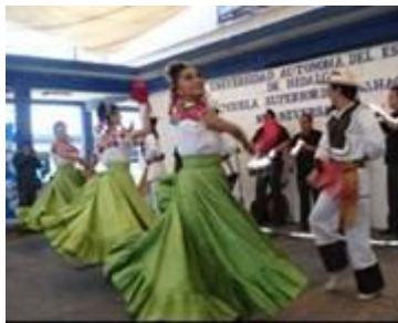
Ballet folklórico de la UAEH en la celebración del 10º aniversario de la ESSAH

Se celebró el 10º aniversario de la Escuela Superior de Ciudad Sahagún, con un emotivo evento para reconocer los avances que ha alcanzado esta unidad educativa de la Universidad Autónoma del Estado de Hidalgo (UAEH). En este marco de celebración se entregaron reconocimientos a los fundadores de esta escuela superior, a los profesores mejor evaluados, alumnos con promedio de 9.5 y a los alumnos con el más alto promedio de la escuela en los programas educativos de Ingeniería Industrial, Contaduría y Profesional Asociado en Trabajo Social. En el mismo evento se suscribió una firma de contrato de comodato por dos años de la Clínica Odontológica que el Club Rotario Ciudad Sahagún entregó a la escuela, con el fin de apoyar a los alumnos y brindar servicios a un bajo costo a quienes más lo necesiten de la población en general, preferentemente infantes.