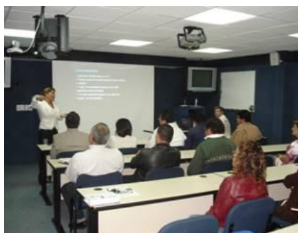
Plática informativa para alumnos y profesores sobre el INEGI