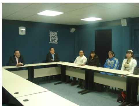
Integrantes del Consejo Técnico, durante la presentación del Programa de Trabajo 2010-2011 de la ESSAH

Dentro de las recomendaciones fundamentales de los organismos evaluadores y acreditadores se encuentra el de movilidad estudiantil, por lo que se apoyó la gestión para que un alumno de la Licenciatura en Contaduría y una alumna de la Licenciatura en Ingeniería Industrial se inscribieran y cursaran un semestre en la Universidad Nacional de Luján en Buenos Aires, República de Argentina.