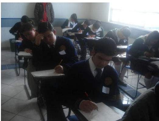
Alumnos participantes en la XXIII Olimpiada de Matemáticas, con sede regional en la ESSAH

Dentro de las actividades de los “Jueves Socioculturales”, se tuvieron diferentes actividades artísticas, como la participación del trovador “Josant”, y de la rondalla “Corazón Bohemio”.