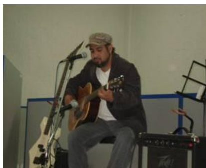
Concierto de trova para la comunidad universitaria de la ESSAH