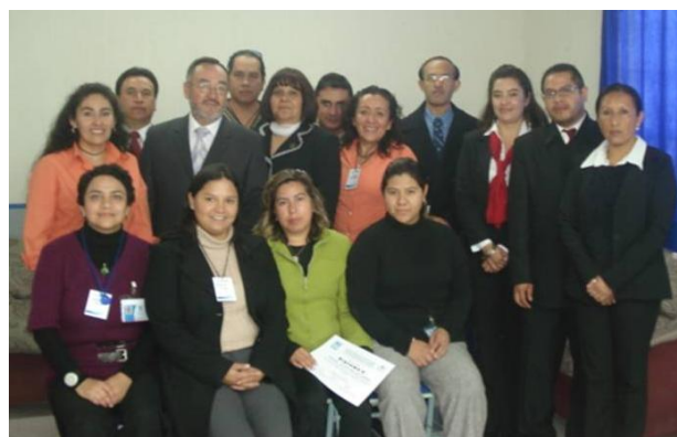
Profesores de inglés participantes en el diplomado Shaping the Way We Teach English

Se llevó a cabo el diplomado Shaping the Way We Teach English, derivado de la vinculación del CAI de la ESSAH y la Embajada Americana en México, en el que participaron profesores de inglés en servicio de escuelas de nivel medio superior y superior de la región.