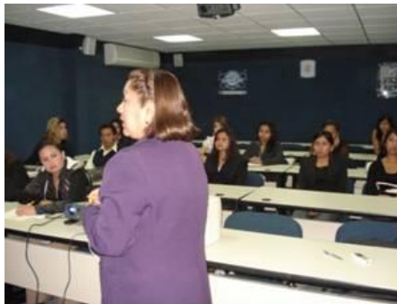
La Directora de la Escuela Nacional de Trabajo Social de la UNAM en la conferencia “Adultos Mayores”