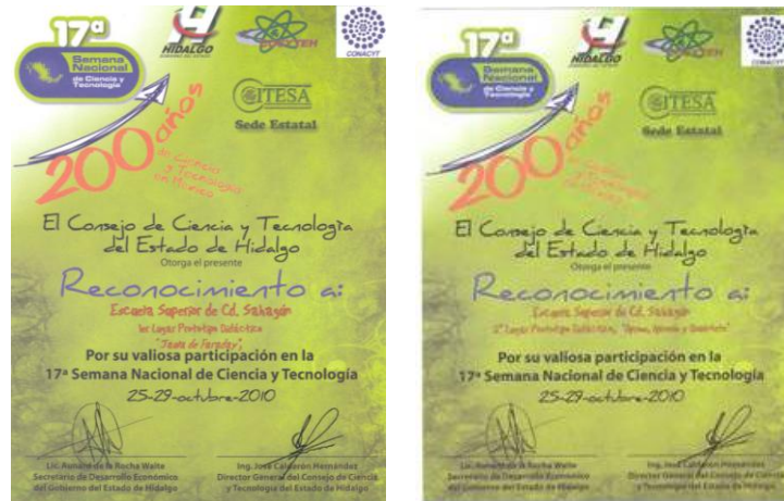
Reconocimiento a la ESSAH por 1er. y 2o. lugar en Prototipo Didácticos

La capacitación de los profesores es fundamental para alcanzar las metas trazadas en materia disciplinar por la ESSAH. Por ello, tres docentes por asignatura participaron en el curso “Instalación de Equipos de Hidráulica y Neumática” impartido por el Senior Experten Services (SES) Franz Magerl, efectuado en el Instituto de Capacitación para el Trabajo de Hidalgo (ICATHI) plantel Apan. De igual manera, un profesor investigador de Ingeniería Industrial participó en los talleres de “Protección de invenciones” y “Signos distintivos”, impartidos por el Instituto Mexicano de la Protección Industrial.