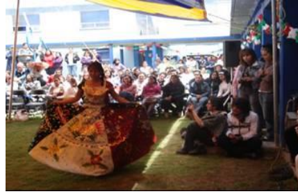
Concurso de trajes típicos durante la ceremonia de conmemoración del Bicentenario de la Independencia de México, celebrada en la ESSAH

También se sigue efectuando la “Pausa para la salud” en la que todos los días, por un lapso de 20 minutos, el profesor y los alumnos de cada grupo realizan una rutina de ejercicios en su aula o fuera de ella, con la finalidad de mantenerse en buenas condiciones físicas y mentales para el mejor desarrollo de sus actividades.