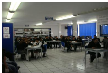
Alumnos de bachillerato participantes en el Maratón Contable

Dentro de las actividades académicas para el fortalecimiento de los procesos de enseñanza, 21 alumnos del programa educativo de Contaduría participaron en el Maratón Fiscal celebrado en el Colegio de Contadores Públicos de México (CCPM), en donde establecieron su nivel de conocimiento con otras instituciones de nivel superior, tales como Universidad Nacional Autónoma de México (UNAM), el Instituto Politécnico Nacional (IPN), Instituto Tecnológico de Estudios Superiores de Monterrey (ITESM), el Instituto Tecnológico Autónomo de México (ITAM) y Escuela Bancaria Comercial, entre otras.