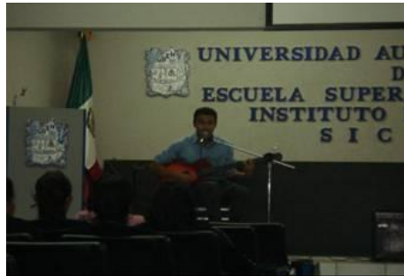
Presentación musical en el auditorio de la ESSAH