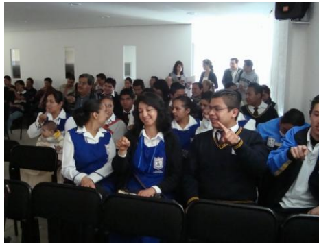
Alumnos y profesores de la UAT campus Calpulalpan