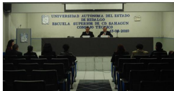
Integrantes del Consejo Técnico de la ESSAH en 1a. sesión de trabajo

Otros de los compromisos adquiridos en el referido programa de trabajo es la ampliación de la oferta educativa; por ello se dio inicio a los estudios de pertinencia y factibilidad, aplicando 1,050 encuestas en los bachilleratos de la región y otras 145 a empresas de diferente giro.