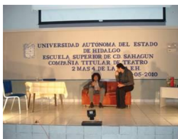
Presentación de la Compañía de Teatro “2 + 4”

Se continuaron las actividades del “Jueves Sociocultural”, entre las que destacan la presentación de la Compañía Titular de Teatro “2 + 4”, dentro de su 35º aniversario, con las obras “Las Enaguas Coloradas” de Román Calvo y “Mujer de Rancho” de Emilio Carballido, a las que asistieron 100 alumnos y profesores de la ESSAH.