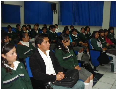
Alumnos del Colegio de Bachilleres participantes en visitas guiadas a la ESSAH

Con la finalidad de dar a conocer la oferta educativa de la Escuela Superior de Cd. Sahagún (ESSAH) y de la UAEH en general, se realizaron visitas guiadas a las instalaciones de la escuela, visitas de promoción y difusión entre las 25 instituciones de educación media superior de las zonas de influencia de esta institución, tales como colegios de bachilleres, centros de bachillerato tecnológico, industrial y de servicios, centros de bachillerato agropecuario y escuelas preparatorias oficiales y privadas de los municipios de Tlanalapa, Zempoala, Emiliano Zapata, Tepeapulco y Apan, del estado de Hidalgo, así como Calpulalpan, del estado de Tlaxcala, y Nopaltepec, Axapusco, San Juan Teotihuacán y San Martín de las Pirámides, del estado de México.