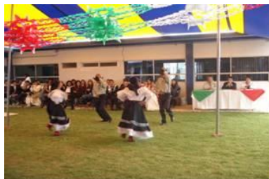
Celebración de la conmemoración del Bicentenario de la Independencia de México, celebrada en la ESSAH

Se llevó a cabo en la ESSAH la conmemoración del Bicentenario de la Independencia de México, en donde la totalidad de la comunidad académica y estudiantil participó en diferentes actividades: Honores a la bandera, izamiento de bandera, baile folklórico, concurso de trajes típicos, concurso de canto y una comida típica mexicana para concluir el evento.