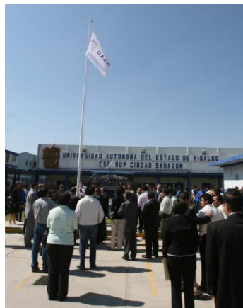
Izamiento de la bandera blanca en la ESSAH