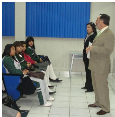
Plática informativa durante las visitas guiadas a la ESSAH