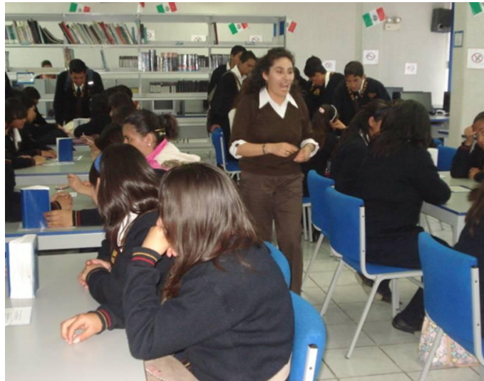
Alumnos del CBTis No. 59 en las instalaciones del Centro de Aprendizaje de Idiomas de las ESSAH

Por otra parte, se iniciaron y concluyeron las gestiones para establecer un convenio de colaboración entre la UAEH y la empresa DINA con sede en Ciudad Sahagún, fabricante de autobuses semiurbanos y urbanos, cuya firma se llevó a cabo en el Edificio Central de la máxima casa de estudios.