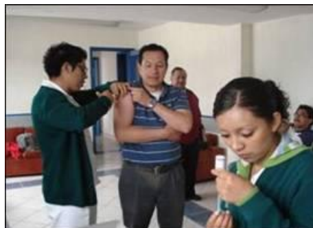
Campaña de vacunación en la ESSAH

La escuela fue sede de la XXIII Olimpiada de Matemáticas, organizada por la Sociedad Matemática Mexicana y el Instituto de Ciencias Básicas e Ingeniería de la UAEH, en la que se registraron 77 alumnos de secundarias y bachilleratos de la región.