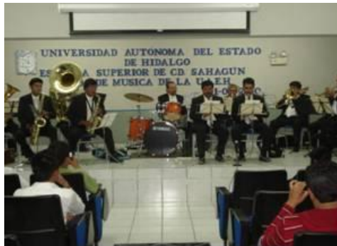
Banda de Música de la UAEH en la ESSAH

Una parte importante de las funciones sustantivas de la UAEH es la promoción de la cultura en la sociedad, por lo que la Tuna Azul y Plata de la UAEH se presentó en la Plaza Rodrigo Gómez de Cd. Sahagún, como parte de los domingos culturales del municipio de Tepeapulco.