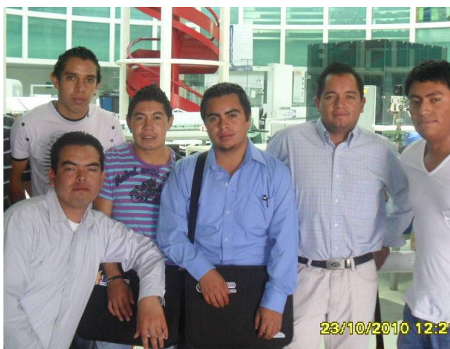
Alumnos de Ingeniería Industrial en los laboratorios de ITESM Campus Puebla

Atendiendo a las directrices del PDI y a las recomendaciones establecidas por organismos de evaluación y acreditación externos, los alumnos de los programas educativos deben asistir a congresos de las áreas disciplinares con el propósito de reforzar los procesos de enseñanza-aprendizaje; en este sentido, 26 alumnos de la licenciatura en Ingeniería Industrial participaron en el Segundo Congreso Internacional IGNIS organizado por el Instituto Tecnológico y de Estudios Superiores de Monterrey (ITESM) Campus Puebla.