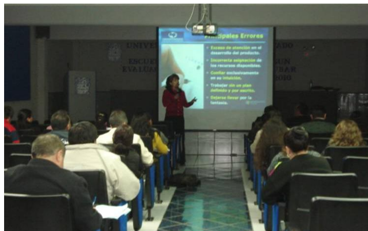
Expositora durante el Curso Taller “Evaluación de Proyectos a Incubar”