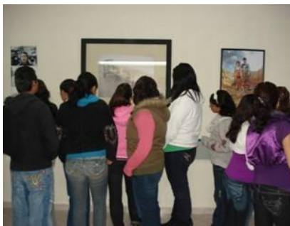
Alumnos en la exposición “Arte Consciente 2010”

También se efectuó la inauguración de la Exposición 1ª Bienal de Artes Visuales “Arte Consciente 2010”, con la asistencia de 150 personas de la comunidad universitaria.