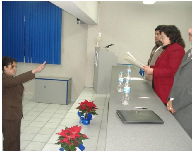
Egresada de Profesional Asociado en Trabajo Social en la toma de protesta

Como parte del programa de extensión de pasantía y cuyo objetivo es elevar los indicadores de desempeño de los programas educativos, ocho egresados de la ESSAH: uno de Contaduría, cinco de Ingeniería Industrial y dos de Profesional Asociado en Trabajo Social, presentaron exámenes profesionales en diferentes modalidades, mejorando con esta acción el índice de titulación de cada carrera.