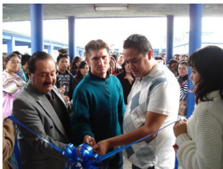
Inauguración de exposición “Orígenes” del acervo de la Fundación Cultural Pascual

También se efectuó la inauguración de la Exposición 1ª Bienal de Artes Visuales “Arte Consciente 2010”, con la asistencia de 150 personas de la comunidad universitaria.