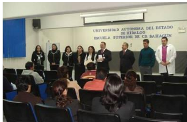
Reunión de padres de familia

Parte importante para la formación integral de los estudiantes de nuevo ingreso a la ESSAH es la participación de los padres de familia en una reunión general, en donde se dan a conocer los lineamientos, así como los servicios académicos que rigen la estancia de sus hijos a lo largo de su trayectoria escolar.