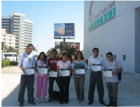
Participantes en el XI Congreso Internacional de Ingeniería Industrial celebrado en la Cd. de Veracruz, Veracruz

Como parte de la formación integral de los alumnos en el idioma inglés, el Centro de Autoaprendizaje de Idiomas realizó un concurso de verbos irregulares en donde participaron 46 estudiantes de los programas educativos de Contaduría e Ingeniería Industrial.