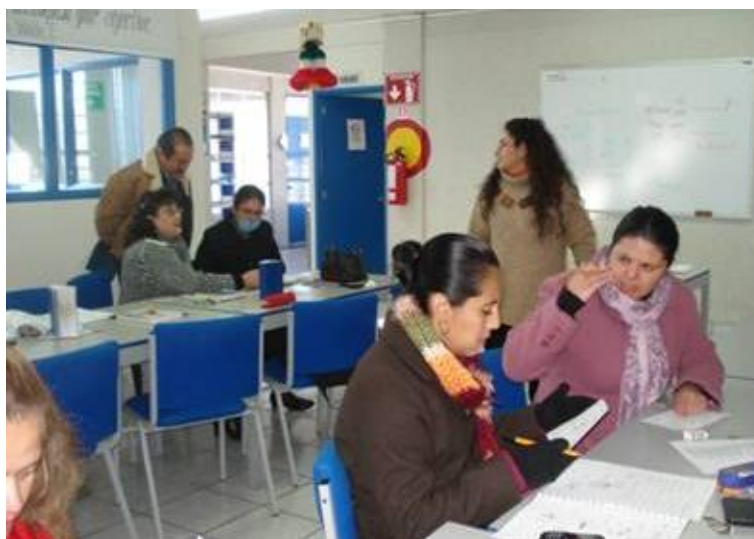
Académicos de la ESSAH en el curso-taller An Introduction to English