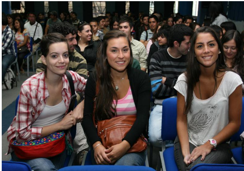
Reunión de Movilidad Internacional y Nacional; Alumnas de la Universidad Nacional de Cuyo, Argentina, de la Licenciatura en Diseño Gráfico que realizan estancia en la Escuela Superior Actopan; Centro de Vinculación y Desarrollo Internacional (CEVIDE); 20 de enero de 2011

Actualmente se encuentran estudiando en la Licenciatura en Diseño Gráfico de esta Escuela, 2 alumnas de la Universidad Nacional de Cuyo de Argentina.