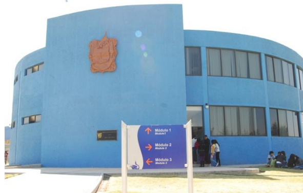
Escuela Superior Actopan (ESA) ; octubre 2010

Su capital humano está integrado por, 110 académicos por asignatura, 16 profesores de tiempo completo y 9 administrativos.