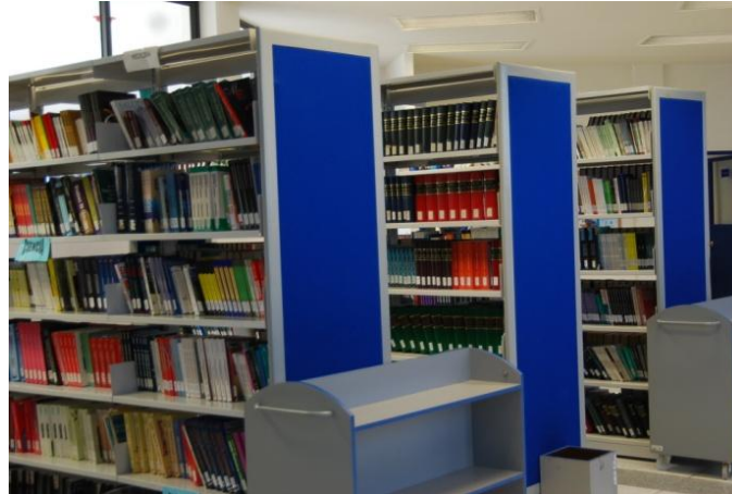
Biblioteca de la Escuela Superior Actopan (ESA) ; octubre 2010

Los servicios académicos fueron mejorados; en biblioteca el acervo bibliográfico aumento de 3409 volúmenes a 3947, se obtuvieron 198 con recursos PIFI y 340 donaciones, representando un incremento del 15.78%