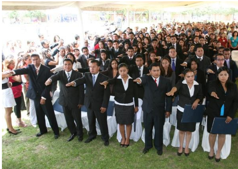
Toma de protesta de , egresados titulados en las licenciaturas de derecho, diseño gráfico y psicología; instalaciones de la Escuela Superior Actopan, 9 de agosto de 2010.