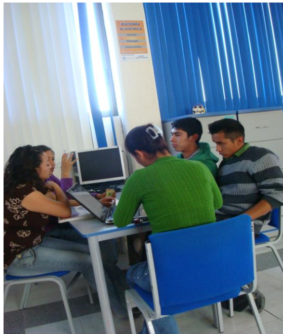
Estudiantes de 2º semestre de la Licenciatura en Derecho de la Escuela Superior Actopan (ESA), participando en el Programa Asesoría de Pares en "Círculo de Estudio", instalaciones de Biblioteca de la ESA.

Dio inicio el programa de asesoría académica de pares, en la que participan 7 prestatarios de servicio social de los programas educativos que se ofertan en esta escuela, apoyando principalmente a los estudiantes de los primeros semestres en temas específicos de las asignaturas de mayor índice de reprobación que propician la deserción escolar, apoyo en tareas y trabajos de investigación, orientación sobre diseño de presentaciones y elaboración de materiales para exposición, así como la creación de círculos de estudio, lo anterior con el objetivo de incrementar el aprovechamiento académico y potencializar las posibilidades de permanencia, retención e incrementar la eficiencia terminal.