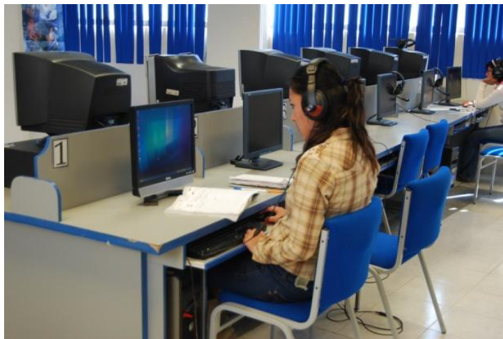
Centro de Autoaprendizaje de la Escuela Superior Actopan (ESA); octubre 2010

En el centro de auto aprendizaje de idiomas también se ampliaron los espacios, de 120 posiciones de servicio que se tenían en 2009, en 2010 se tienen 154, lo que representa un incremento del 28%.