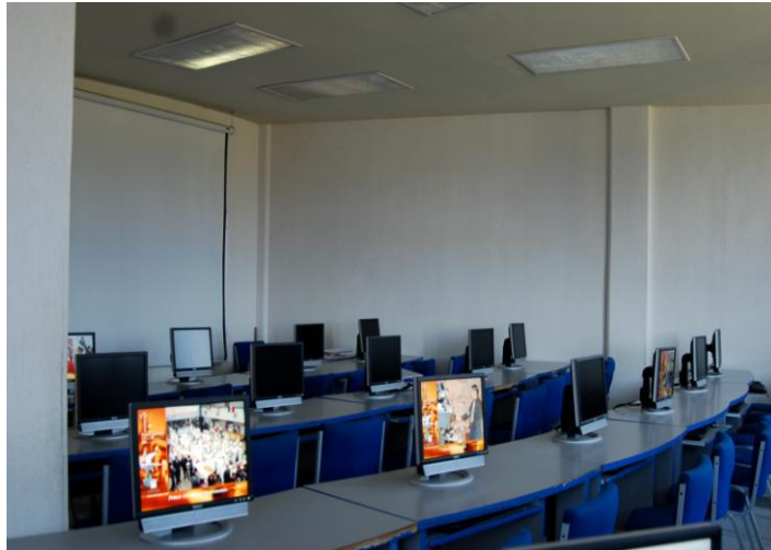
Aula de Cómputo, Escuela Superior Actopan, noviembre 2010

Los servicios del Centro Cómputo Académico también fueron ampliados, se incrementó en un 10% el equipamiento y los usuarios llegaron a 3734.