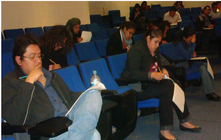
Desarrollo del Examen EGEL 2010, Alumnos de Diseño Gráfico, Auditorio de la Escuela Superior Actopan (ESA)

El Examen General de Egreso (EGEL) que evalúa el nivel de habilidades y conocimientos propios de cada una de las licenciaturas se aplicó a 96 alumnos de las 3 licenciaturas de los cuales 23 obtuvieron reconocimiento de desempeño satisfactorio.