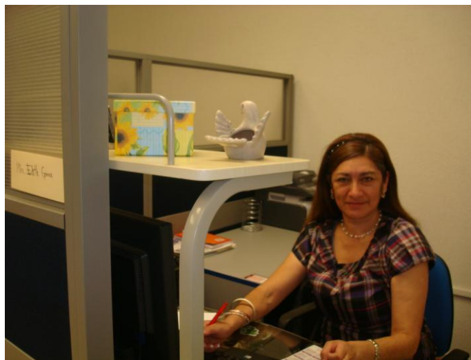
Cubículos de Profesores de Tiempo Completo; enero 2011

El mobiliario de la escuela incremento con la adquisición de 20 computadoras y 20 proyectores para las aulas, 13 computadoras y 13 impresoras para las diversas áreas; y se habilitó un área con 7 cubículos para Profesores de Tiempo Completo.