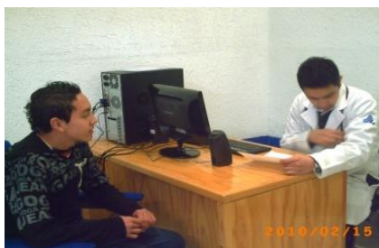
Servicio Médico integrado a partir de la presente gestión

Se llevaron a cabo dos reuniones con padres de familia, con la participación de aproximadamente 2000 padres de familia, donde se presentó a los profesores tutores de cada grupo, se dieron a conocer los logros de la escuela y los compromisos del Lic. Agustín Sosa Castelán hacia la comunidad en general. Posteriormente se ubicaron en los diferentes salones los padres y tutores de grupo para dar a conocer la situación académica y personal de cada uno de los alumnos.