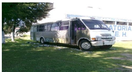
Primer autobús que tendrá la comunidad preparatoriana

Se gestionó la adquisición de un autobús para uso exclusivo de la comunidad de prepa 2, para fines académicos, deportivos, culturales de extensión y vinculación.