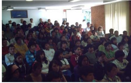
Pláticas obligatorias para alumnos(as) con beca

Se brindaron 287,078 servicios académicos en las áreas de Cómputo, Laboratorios y Biblioteca y Centro de Autoaprendizaje de Idiomas.