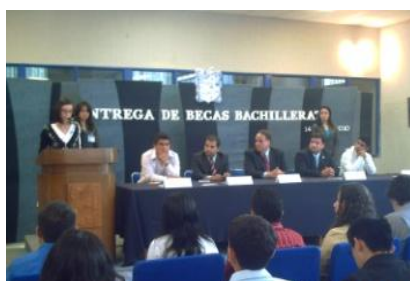
Ceremonia de entrega de Becas Bachillerato

Se otorgaron las Becas Bachillerato UAEH a 133 alumnas(os); actualmente el 19% de nuestros alumnos cuentan con este tipo de becas, además de las becas Oportunidades, SEP y Sociedad de Alumnos. Logrando un incremento del 231% con respecto al año pasado.