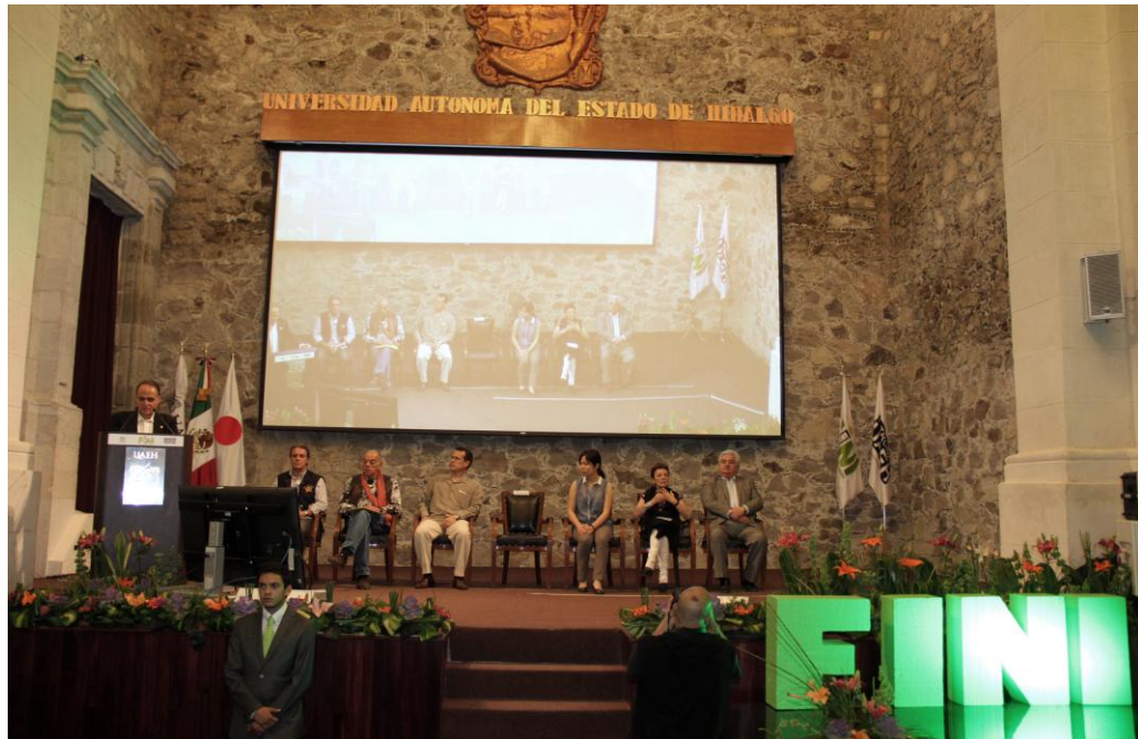
En el Festival Internacional de la Imagen de 2013 se contó con la presencia de personalidades nacionales y extranjeras del mundo de la fotografía y el video

A inicios del año 2013 se tuvo una reunión con los directores de las dependencias que forman parte del organigrama de la Dirección General de Comunicación Social y Relaciones Públicas para hacer hincapié de la importancia de su compromiso con la Universidad Autónoma del Estado de Hidalgo y con su Rector, Mtro. Humberto Augusto Veras para dar cumplimiento al PDI 2011-2017 y a las exigencias del proceso actual de internacionalización.