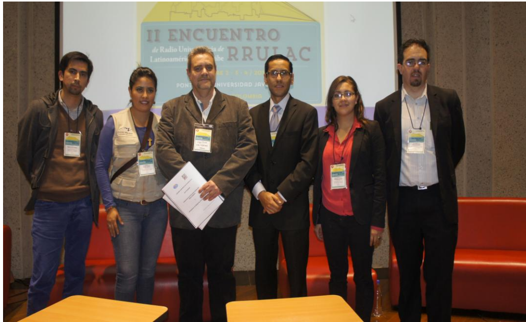
El equipo de Radio Universidad en aras de la internacionalización participo en el II Encuentro RRULAC en Bogotá Colombia

Diseñar y operar los lineamientos de relaciones públicas, protocolos y atención a invitados y visitantes para fortalecer la imagen institucional es el objetivo estratégico de la Dirección de Relaciones Públicas, dependiente de la DGCSyRP. Para dar cumplimiento a este objetivo se requiere de la participación del EPI (Equipo de Protocolo Institucional) que a la fecha está integrado por 25 elementos entre hombres y mujeres cumpliendo así con el Modelo de Equidad de Género que prevalece en la Universidad. Con el apoyo de este grupo de jóvenes universitarios se han podido cubrir un total de 116 eventos institucionales, en donde la presencia del EPI es de vital importancia.