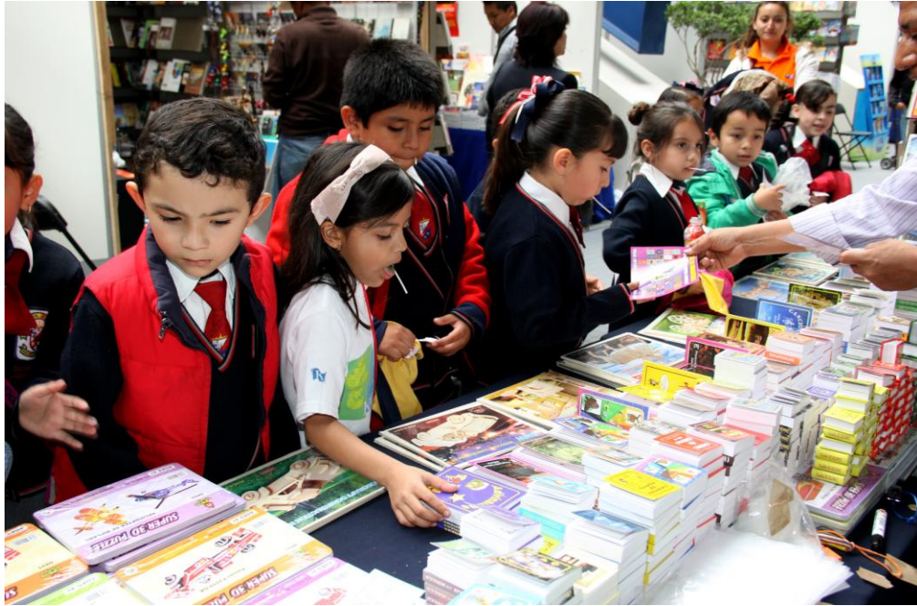
En la FUL 2013 la presencia de los niños fue importante con lo que se cumple como institución de educación de sembrar la semilla de la lectura

En el caso del FINI se produjeron 7 programas especiales, se realizaron 29 entrevistas a invitados del coloquio, a jurados y ganadores del concurso, a invitados especiales y talleristas. Asimismo, se tuvieron transmisiones especiales de las cuales 3 fueron en vivo y 7 diferidas; y como es un evento de corte internacional se realizó la producción de promocionales permanentes en inglés, francés, alemán y japonés.