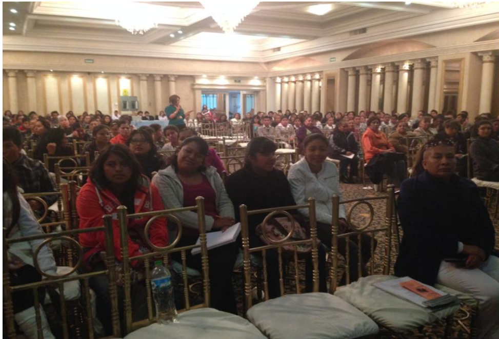
La profesionalización del EPI en los campus universitarios permitirá apoyar los eventos institucionales con la calidad de una universidad de vanguardia

La Dirección de Relaciones Públicas con el afán de fortalecer la imagen institucional y crear un vínculo con los universitarios y la sociedad en general, semanalmente publica la Agenda Institucional, documento a través del cual se dan a conocer en la Página Web de la universidad, los eventos académicos, de investigación, culturales, deportivos y/o de vinculación que se desarrollarán en la institución durante ese período; en 2013 se emitieron 45 agendas.