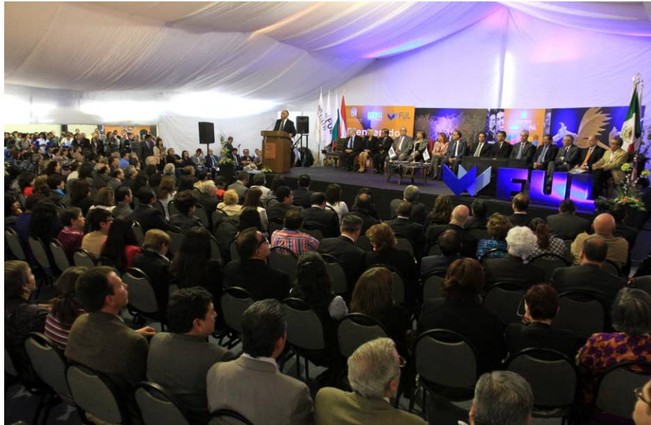
Inauguración de la Feria Universitaria del Libro 2013

boletines de los cuales se desprendieron 187 notas informativas en medios impresos; se contabilizaron 109 menciones en redes sociales , 6 en radio y 4 en televisión y se tomaron 801 imágenes fotográficas.