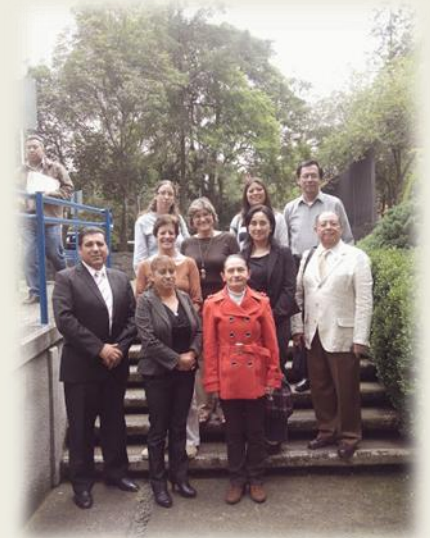
Comisión a la Matrícula: UNAM, UAEH, UAEmex, BUAP, USLP y UAY. Oficinas de la Auditoría Interna de la UNAM.

La Contraloría General participó en la revisión de la Guía de Auditoría a la Matrícula a través de la cual las UPES concursan en el Fondo para elevar la calidad de la educación superior de las Universidades Públicas Estatales (FECES), así como para las auditorías a la matrícula del Informe al Primer y Segundo Semestre, en consideración a los arts. 41 y 43 del PEF 2014