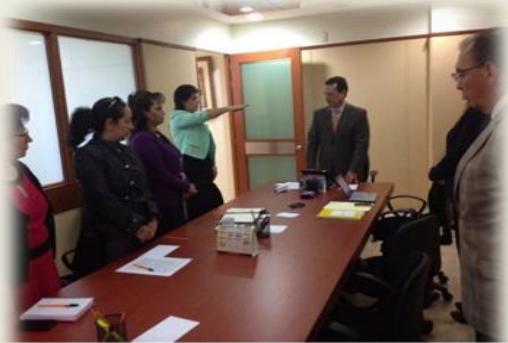
Segunda Sesión Ordinaria del Comité de Transparencia y Acceso a la Información de la UAEH

Durante el año 2014, el Comité de Transparencia y Acceso a la Información de la Universidad, consolidando su compromiso de rendir cuentas de manera eficaz, celebró tres sesiones de las que dos fueron ordinarias y una extraordinaria.