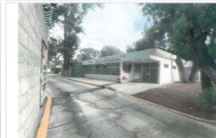
FOTOGRAFIA ANTES (F5). Foto tomada al ingreso al módulo por atender Clínicas Odontológicas.

De conformidad al oficio emitido por la Subsecretaría de Educación Superior número 511/2026-0710-22 de fecha 3 de marzo de 2026, esta Institución se encuentra en proceso de Rectificación de proyecto de conformidad al recurso otorgado.