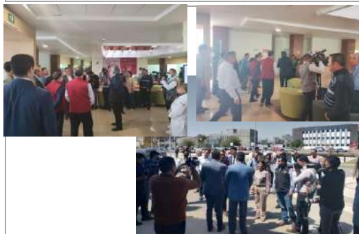
FOTO 4: Evento de inauguración de obra