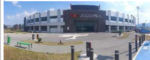
FOTO 5: Panorámica exterior edificio de aulas multidisciplinarias (Servicios Académicos)