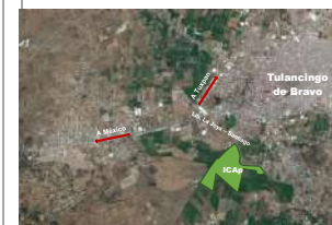
Avenida Universidad Km. 1 s/n, Exhacienda Aquetzalpa, Tulancingo de Bravo, Hidalgo, C.P. 43600