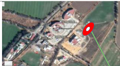
UBICACIÓN DE LA OBRA CIUDAD UNIVERSITARIA DE TULANCINGO