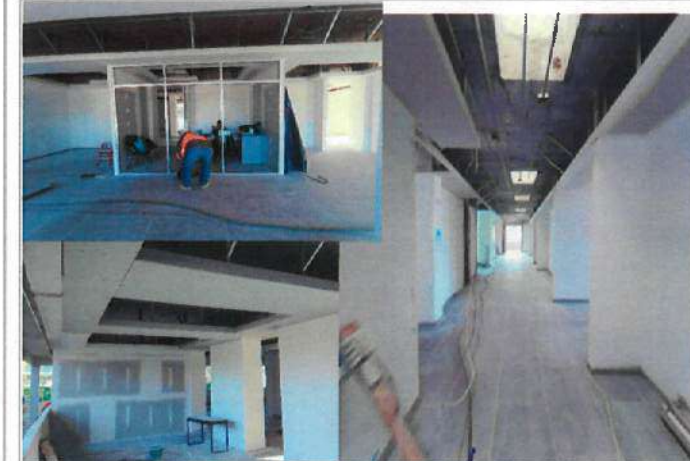
FOTOGRAFÍAS 3 (F3). Trabajos interiores en plafones, suministro y colocación de cancelerías y pisos.