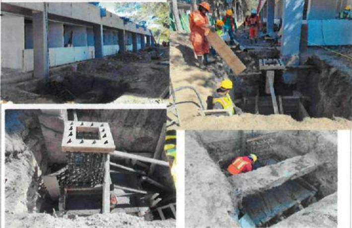
FOTOGRAFÍAS 4 (F4). Trabajos exteriores: Preliminares, armado y habilitado de acero para zapatas de desplante para la estructura de acero en primer nivel.

Observaciones: Continuación de trabajos de demolición y retiro de cancelerías, instalaciones, mobiliario; Trabajos en interiores relativos a la construcción de muros de block, suministro y colocación de muros divisorios, plafones, cancelerías y pisos. Trabajos exteriores: Preliminares, armado y habilitado de acero para zapatas de desplante para recibir estructura de acero en primer nivel.