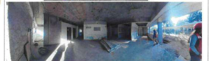
FOTOGRAFÍA ANTES, DURANTE Y DESPUÉS. Exterior del módulo intervenido. Interior Pasillos centrales.