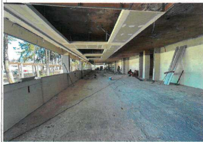
FOTOGRAFÍAS 1 (F1). Continuación de trabajos de demolición y retiro de cancelerías, instalaciones, mobiliario.