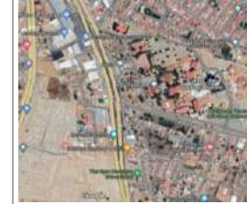
Carretera Ciudad Sahagún-Otumba s/n, Zona Industrial Ciudad Sahagún, Tepeapulco, Hidalgo, C.P. 43990