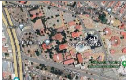
UBICACIÓN DE LA OBRA CIUDAD DEL CONOCIMIENTO DE LA UAEN