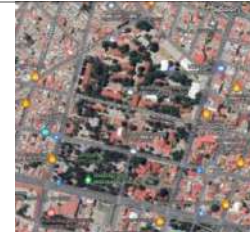
Dr. Eliseo Ramírez Ulloa 400, Doctores, 42090 Pachuca de Soto, Hgo.