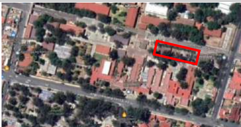
UBICACIÓN DE LA OBRA INSTITUTO DE CIENCIAS DE LA SALUD.- Ex hospital Civil