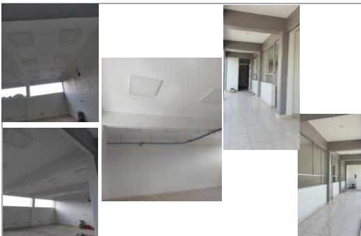
FOTO 2: Terminación de trabajos de suministro y colocación de acabados en pisos, pintura interior y exterior y trabajos de instalación eléctrica (colocación de accesorios)

Comentarios de los trabajos realizados: Instalaciones eléctricas y voz y datos, equipos de aire acondicionado, equipos detección de incendios, cableados, y trabajos de media tensión; trabajos de impermeabilización; acabados y cancelerías.