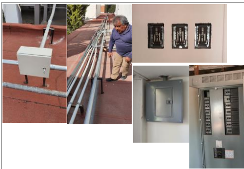
FOTO 1: Conclusión de trabajos de instalación eléctrica en azoteas y conclusión trabajos de instalación eléctrica: suministro, colocación de tableros eléctricos.