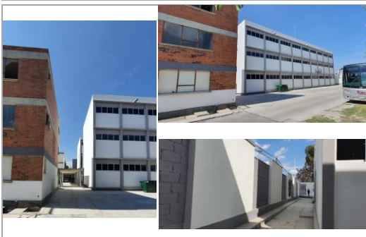
FOTO 4: Conclusión de trabajos de acabados en los dos módulos atendidos