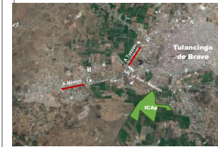
Avenida Universidad Km. 1 s/n, Exhacienda Aquetzalpa, Tulancingo de Bravo, Hidalgo, C.P. 43600