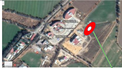
UBICACIÓN DE LA OBRA CIUDAD UNIVERSITARIA DE TULANCINGO