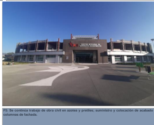
F5: Se continúa trabajo de obra civil en azotea y pretilles; suministro y colocación de acabado en columnas de fachada.