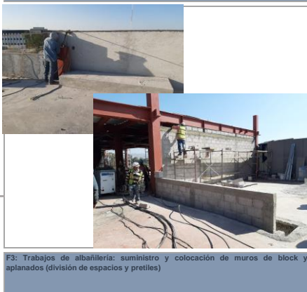
F3: Trabajos de albañilería: suministro y colocación de muros de block y aplanados (división de espacios y pretilles)

Continuación de trabajos en estructura para colado de losa; estructura de escaleras: demoliciones; muros, castillos, cadenas; acabados: aplanados, pisos, rellenos, entortados, impermeabilizante; reubicación de domos; instalaciones: hidráulicas, sanitarias eléctricas, multimedia; sistemas: aire acondicionado, ductería para instalación contraincendio; cancelería de aluminio y plafones.