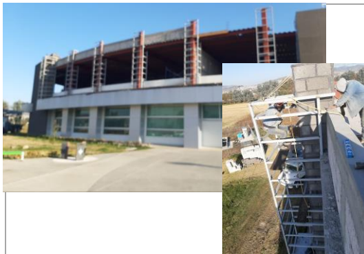
F2: Trabajos de albañilería en pretilles y fachadas; Suministro y colocación de estructura de metalica en columnas para acabado en fachada a base de placas de alucobond