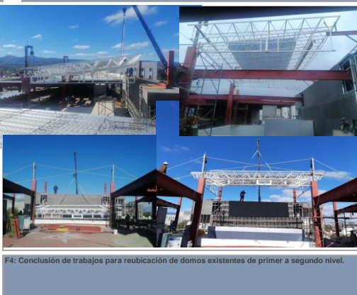
F4: Conclusión de trabajos para reubicación de domos existentes de primer a segundo nivel.