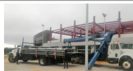
F1: Suministro y colocación de estructura de acero en 2do nivel de edificio existente.