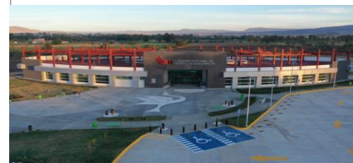
F5: Suministro y colocación de estructura de acero en azotea de edificio de aulas multidisciplinarias (V15Servicios Académicos).

Comentarios de los trabajos realizados: Suministro y colocación de Estructura de acero, armado de losacero y preparación de superficie para colado en 2do nivel de edificio existente.