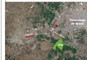
Avenida Universidad Km. 1 s/n, Exhacienda Aquetzalpa, Tulancingo de Bravo, Hidalgo, C.P. 43600