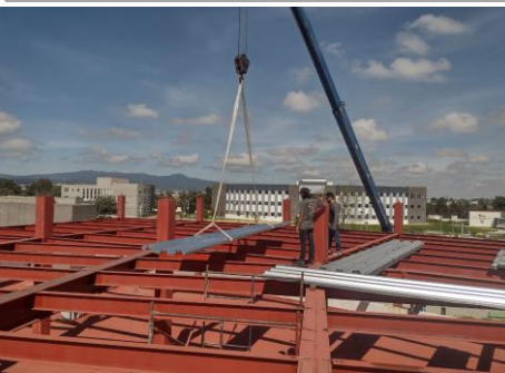
F4: Colocación de losacero para preparación de colado de losa.

Comentarios de los trabajos realizados: Suministro y colocación de Estructura de acero, armado de losacero y preparación de superficie para colado en 2do nivel de edificio existente.