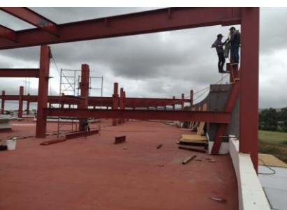
F3: Trabajos para la colocación de vigas de acero y losacero en estructura existente