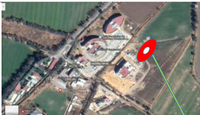
UBICACIÓN DE LA OBRA CIUDAD UNIVERSITARIA DE TULANCINGO