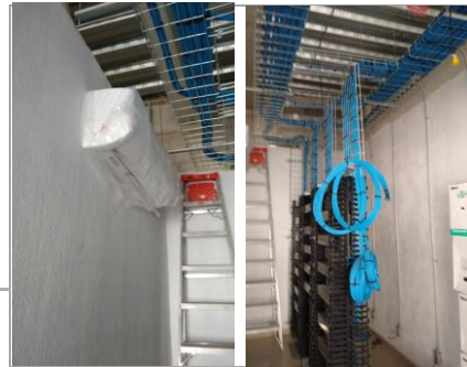
F3: Cableado estructurado de telecomunicaciones