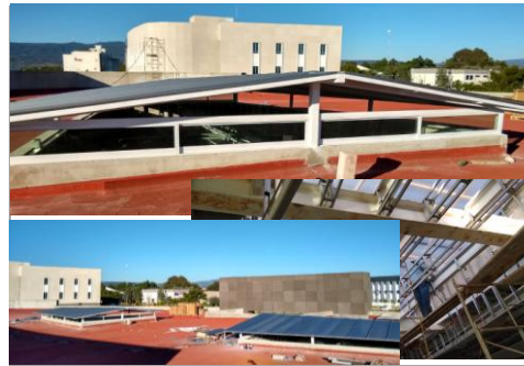
F4: Colocación de domos y tridlosas

Comentarios de los trabajos realizados: Despalme, piedraplen, tepetate del área de estacionamiento y andadores. Cubiertas y policarbonatos en cielos interiores; Cableado estructurado de telecomunicaciones; Plafones lisos; Registros y ducterías exteriores eléctricos.