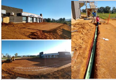
F2: Trabajos para obra exterior