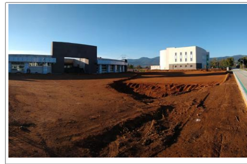
F5: Panorámica de Edificio. Conformación de plataformas en exterior para andadores y obra exterior (estacionamiento)

Comentarios de los trabajos realizados: Despalme, piedraplen, tepetate del área de estacionamiento y andadores. Cubiertas y policarbonatos en cielos interiores; Cableado estructurado de telecomunicaciones; Plafones lisos; Registros y ducterías exteriores eléctricos.