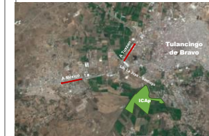
Avenida Universidad Km. 1 s/n, Exhacienda Aquetzalpa, Tulancingo de Bravo, Hidalgo, C.P. 43600