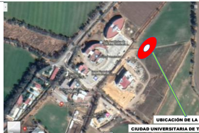
UBICACIÓN DE LA OBRA CIUDAD UNIVERSITARIA DE TULANCINGO