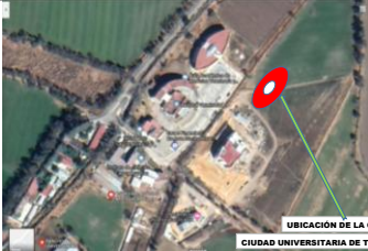
UBICACIÓN DE LA OBRA CIUDAD UNIVERSITARIA DE TULANCINGO