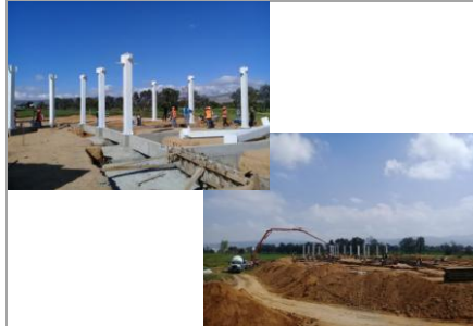
F2: Desplante de columnas de acero en estructura.

Comentarios de los trabajos realizados: Continuaci6n de habillado de estructura de acero (columnas y vigas)