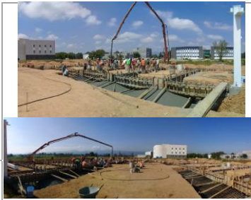
F3: Colado de concreto en estructura de cimentaci6n (zapatas, contratables)

Comentarios de los trabajos realizados: Continuaci6n de habillado de estructura de acero (columnas y vigas)