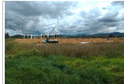
F5: Foto panor6mica del terreno donde se observa desplante de estructura del edificio. (columnas de acero)