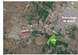
Avenida Universidad Km. 1 s/n, Estaci6n Acuetzalco, Tulancingo de Bravo, Hidalgo, C.P. 43600