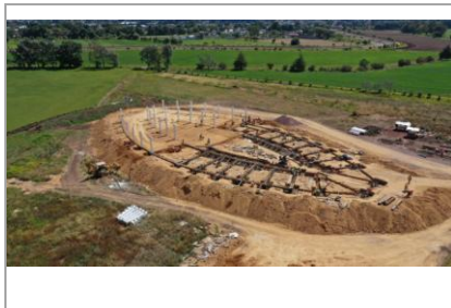
F4: Trabajos realizados en cimentaci6n y estructura (colados y desplante de columnas)