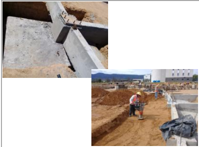
F1: Colado de zapatas alisadas y compactaci6n de rellenos