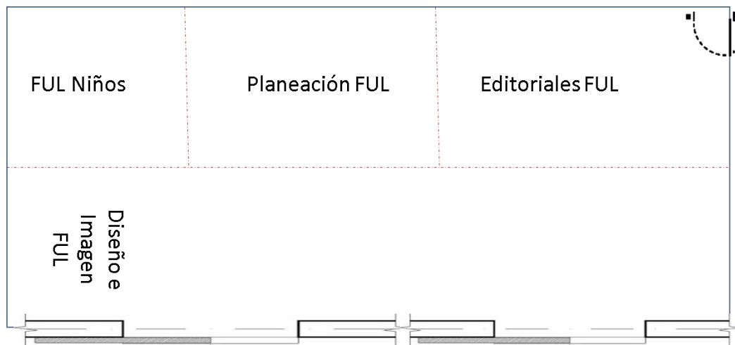
Oficina Anexo FUL