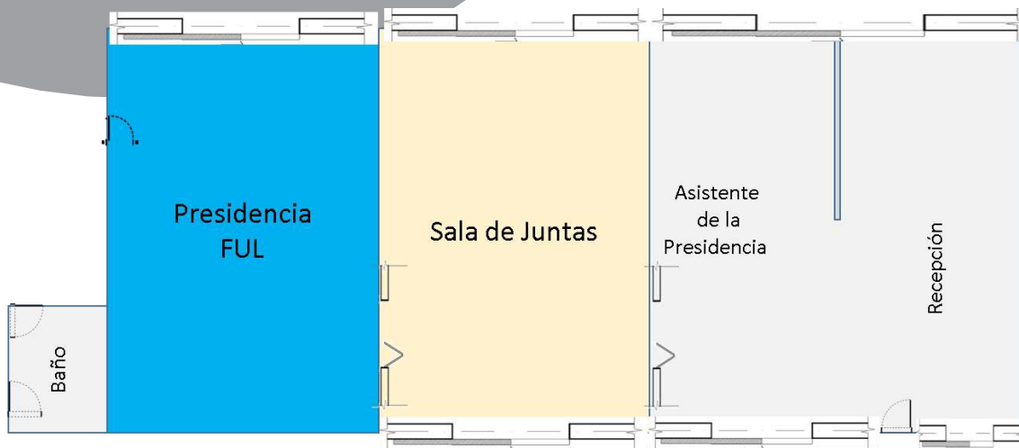
Oficina Principal FUL