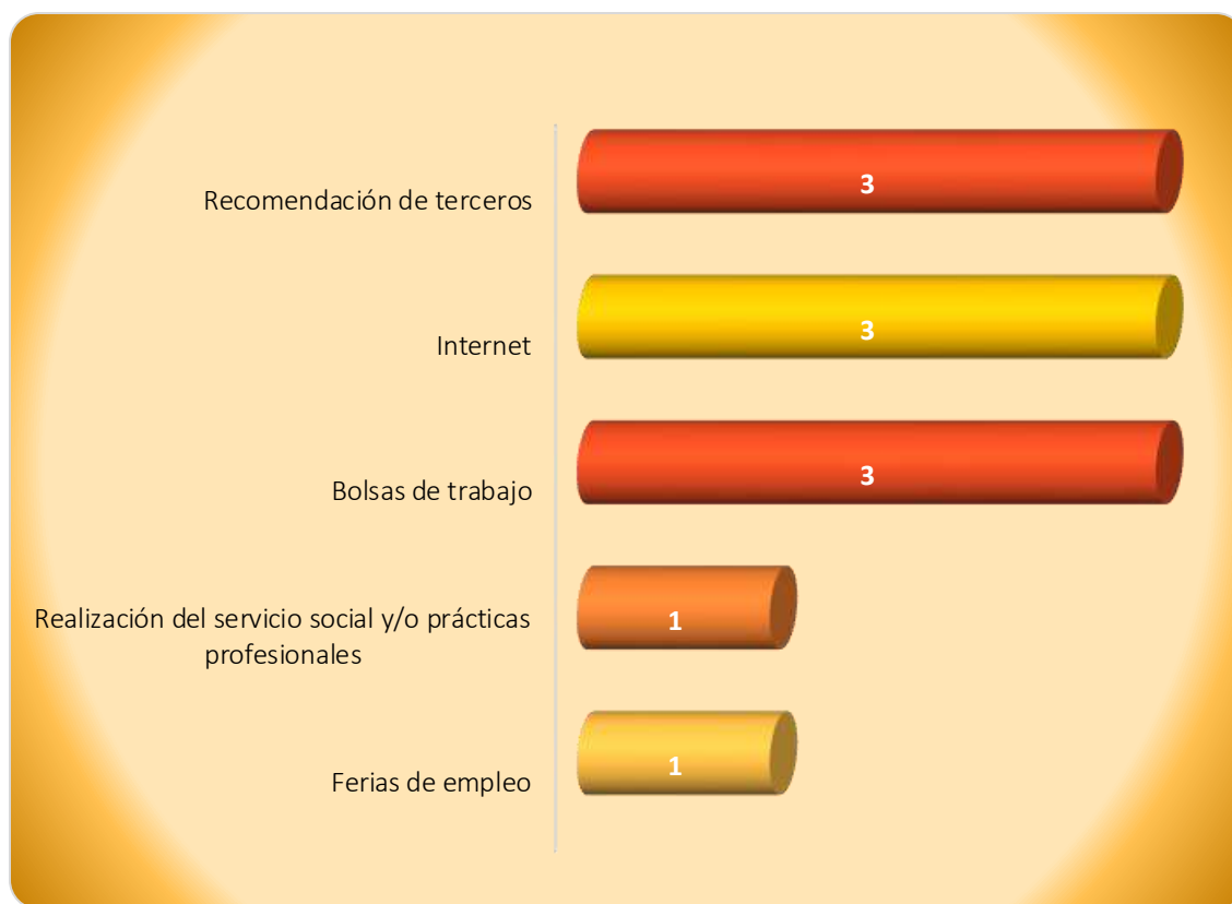
Gráfica 2.1 Medios de reclutamiento más utilizados por los empleadores

La Gráfica 2.1 muestra los medios de reclutamiento para el proceso de contratación observándose que el mayormente utilizado por los empleadores y/o personal de recursos humanos es a través de la recomendación de terceros, internet y las bolsas de trabajo debido a que 3 de los 5 empleadores así lo manifestaron. Otros medios seleccionados fueron; a través de la realización del servicio social y/o prácticas profesionales y las ferias de empleo.