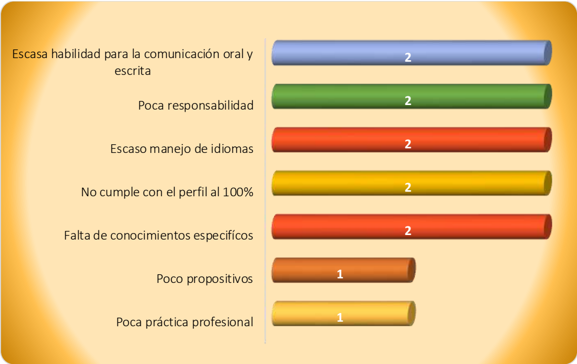
Gráfica 2.3 Principales debilidades de los egresados al momento de la contratación

egresados de esta licenciatura. Otras debilidades señaladas fueron; poco propositivos y poca práctica profesional, ver Gráfica 2.3.