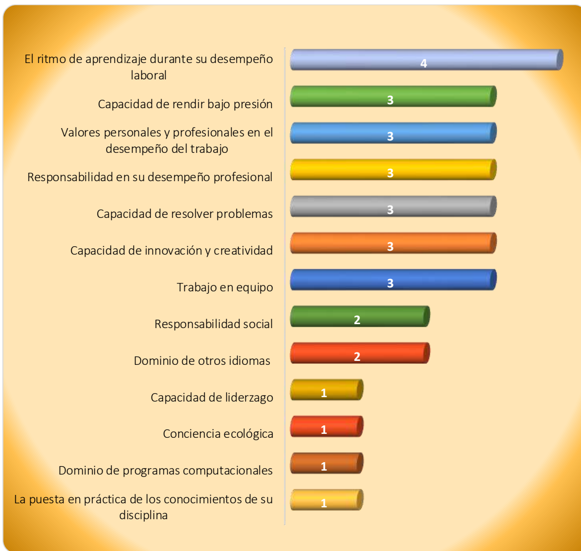
Gráfica 3.1 Aspectos más importantes que poseen los egresados de esta licenciatura, considerados por los empleadores

dominio de otros idiomas, así como la capacidad de liderazgo, la conciencia ecológica, el dominio de programas computacionales y la puesta en práctica de los conocimientos de su disciplina, ver Gráfica 3.1.