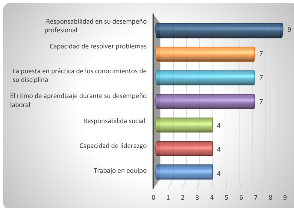
Gráfica 3.1 Aspectos más importantes que poseen los egresados de esta licenciatura, considerados por los empleadores

de aprendizaje durante su desempeño laboral, señalado por 7 empresas respectivamente. Otras capacidades seleccionadas por los empresarios y/o responsables del departamento de recursos humanos son: la responsabilidad social, la capacidad de liderazgo y el trabajo en equipo, capacidades declaradas por 4 empresas respectivamente.