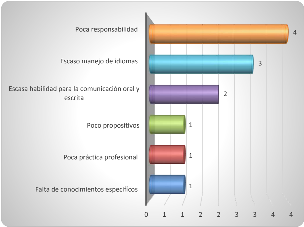
Gráfica 2.3 Principales debilidades de los egresados al momento de la contratación