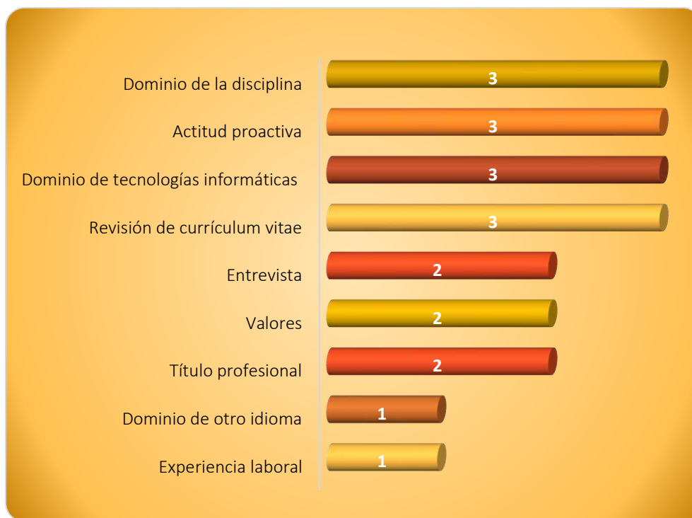
Gráfica 2.2 Requisitos más importantes para determinar la contratación

Los requisitos que determinan la contratación de los egresados se muestran en la Gráfica 2.2. Observándose que 3 empleadores consideran principalmente el dominio de la disciplina, la actitud proactiva, el dominio de las tecnologías informáticas, y la revisión del currículum vitae respectivamente. Para 2 empleadores lo que mayormente consideran es el resultado de la entrevista, los valores manifestados por los egresados, la obtención del título profesional, el dominio de otro idioma y la experiencia laboral.