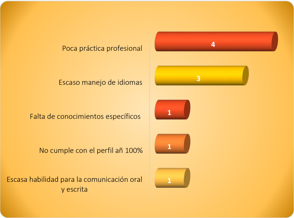
Gráfica 2.3 Principales debilidades de los egresados al momento de la contratación