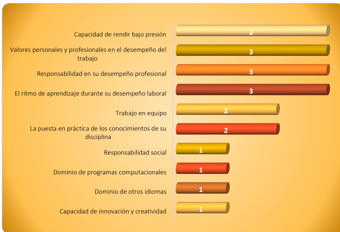
Gráfica 3.1 Aspectos más importantes que poseen los egresados de esta licenciatura, considerados por los empleadores

mencionadas fueron: La responsabilidad social, el dominio de programas computacionales, el dominio de otros idiomas y la capacidad de innovación, ver Gráfica 3.1.