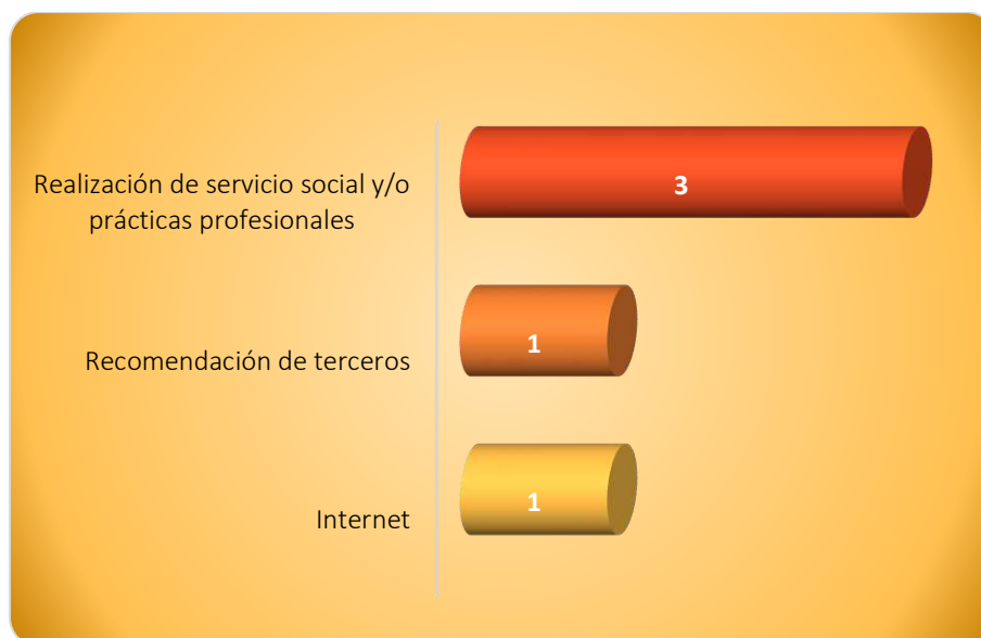
Gráfica 2.1 Medios de reclutamiento más utilizados por los empleadores

La Gráfica 2.1 muestra los medios de reclutamiento para el proceso de contratación observándose que el mayormente utilizado por los empleadores y/o personal de recursos humanos es a través de la realización de las prácticas profesionales y/o servicio social debido a que 3 de los cuatro empleadores así lo manifestó. La recomendación de terceros y a través de internet son otros medios utilizados por los empleadores.