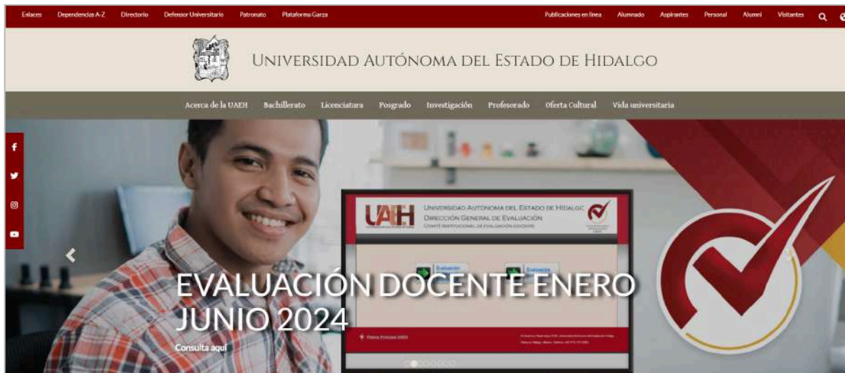
Imagen 4. Slider en la página web universitaria

Para dar a conocer a la comunidad universitaria los períodos de evaluación, se emplearon distintos medios de difusión como se muestran enseguida.