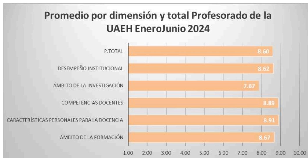
Gráfico 1. Promedio del profesorado Enero-Junio 2024

En el gráfico, se aprecia tanto el promedio total, como el correspondiente a las dimensiones valoradas respecto a la actividad docente.