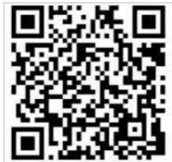
Imagen 3. Código de acceso

Asimismo, fue posible acceder por medio del código QR en dispositivos móviles.