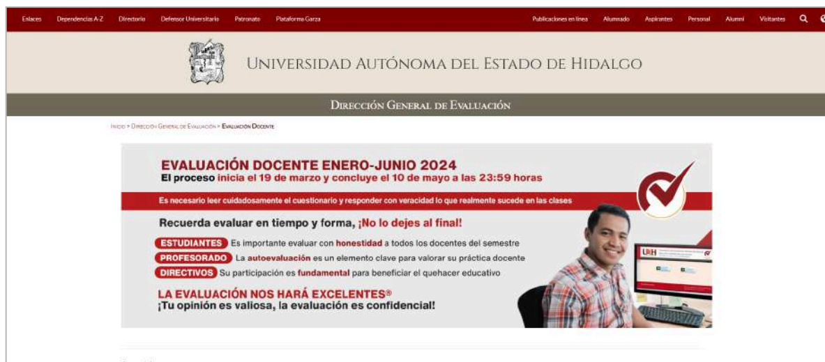
Imagen 5. Contenido del banner