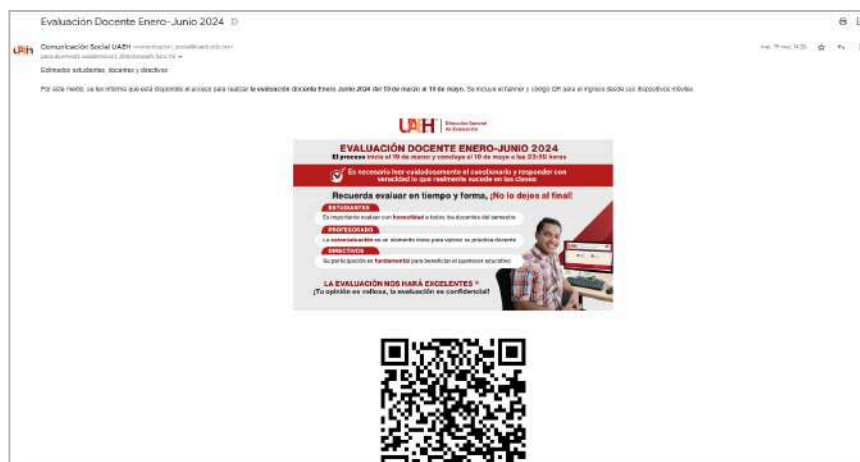
Imagen 8. Correos masivos a profesorado

De igual manera, se realizó el envío de correos a los docentes con información sobre el proceso y realizar así su autoevaluación.