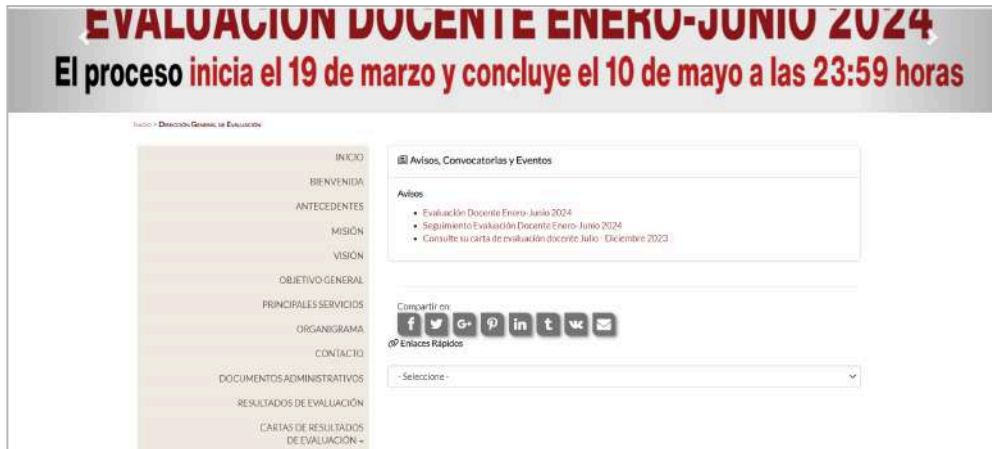
Imagen 7. Aviso portal de la DGE

Asimismo, se incluyó el aviso en el portal de la DGE.