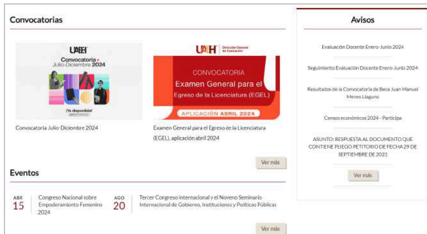
Imagen 2. Aviso en la página de la universidad

El acceso se mantuvo a través de la sección de avisos institucionales en la página web de la universidad.